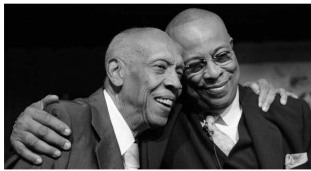
Bebo y Chucho Valdés.

6:59 Cartelera 7:00 Upa nene 7:25 HI-5 7:46 El tren de los cuentos 7:57 Yo puedo cocinar 8:10 Domingo en casa: 12 citas de Navidad 9:40 Algo para recordar: Jezabel 11:23 Cinema joven: Harry Potter y el misterio del príncipe 1:53 Filmequito: El mago de los sueños 3:26 Tarde de domingo: E.T. el extraterrestre 5:29 Cine de aventuras: Furia de titanes 7:18 Horizontes del Oeste: Érase una vez en el Oeste 10:06 Multicine: Atracción peligrosa 11:55 Tiempo de cine: Atrapado sin salida 2:08 Retransmisión