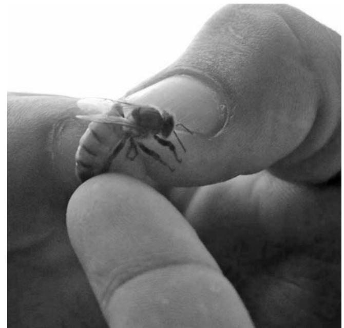
Una buena reina asegura hasta 3 000 huevos diarios.

Sin necesidad de experimentos exóticos ni de muchas ecuaciones matemáticas, los apicultores espirituanos vienen aprendiendo de una máxima que parece más terrenal que la popularizada hace más de 2 000 años por el sabio