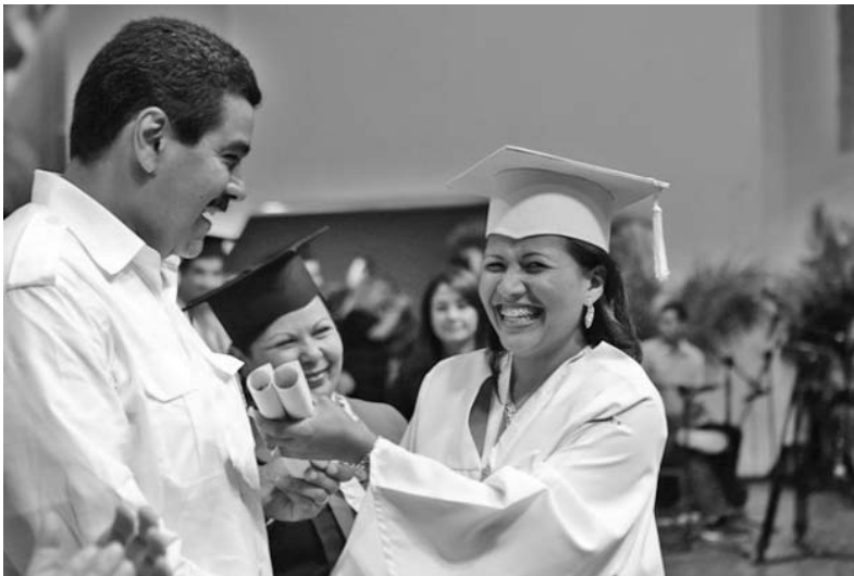
El Presidente Encargado de Venezuela, Nicolás Maduro junto a una de las graduadas.

Dos de los motores del cohete espacial que llevó al hombre por primera vez a la Luna fueron rescatados del fondo oceánico por una expedición, informó la NASA. Un equipo financiado por el fundador de la librería virtual Amazon, Jeff Bezos, encontró y recuperó dos motores Saturn 5 a tres kilómetros de profundidad en el océano Atlántico, tras un año de búsqueda. Los motores aún son propiedad del gobierno de Estados Unidos, y tras su restauración serán expuestos públicamente. (PL)