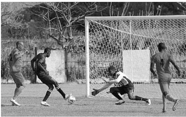
Tras cuatro partidos sin anotar, el Expreso villaclareño anda en busca del gol perdido.

Aunque si de rachas se trata, ninguna como la del submonarca Camagüey, que cuenta sus partidos por victorias y todo le sale; al punto de que si no marca, la fortuna le sonríe con un autogol del adversario, como ocurrió en su