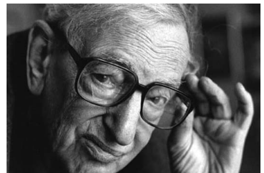
El historiador marxista Eric Hobsbawm

Durante la gira Qva Libre, ganadora del Premio Cubadisco 2011 en la categoría de fusión, hará un repaso por distintas vertientes de su repertorio y estrenará nuevos temas de su factoría musical (M.H)