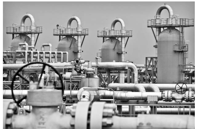
Las ventas de gas ruso a China podrían llegar a los 60 mil millones de metros cúbicos.

AFP refiere que el de Mendoza (1 000 kms al oeste de Buenos Aires) es uno de los numerosos juicios por violaciones de los derechos humanos que se llevan a cabo en Argentina, desde que en el 2003 fueron anuladas por el Congreso las leyes de amnistía de 1986 y 1987.