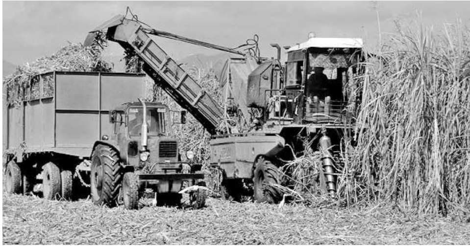
La falta de suministro de caña es el problema principal que tiene hoy la molienda.

Héctor Molina. Una explosión en la llamada casa de calderas durante la fase de pruebas (por fortuna no provocó daños personales) atrasó la arrancada en varios días. Esta situación crea otra vez trastornos en la zafra de Mayabeque dado que el Héctor Molina es su máximo productor.