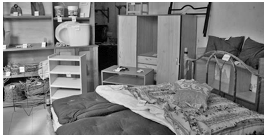
Más de 200 producciones han ido al mercado nacional a través del MINCIN.

En tal sentido, Pantaleón precisó que en esta planta de aerosoles se realizó la necesaria inversión que permitió el cambio de gas que antes se usaba y dañaba la capa de ozono por un gas licuado, el cual protege el medio ambiente.