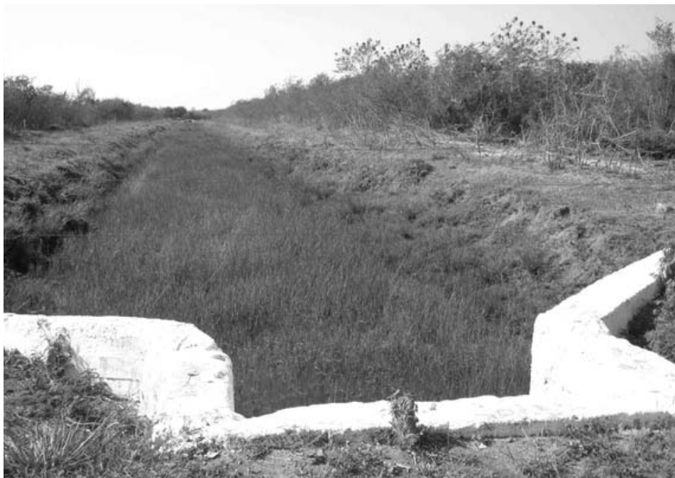
Antes perdidos bajo el marabú y la maleza, los canales de riego de Camalote recuperan poco a poco su valor de uso.

este año y, en algunos casos, replantearnos nuevas metas, pues la garantía de agua crea un escenario mucho más favorable para el incremento de determinados renglones”.