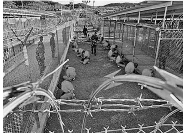
Diversas pruebas y testimonios de exretenidos han demostrado que EE.UU. no respeta los más básicos derechos humanos en la cárcel de la ilegal base naval de Guantánamo.

En un comentario sobre las protestas de los reclusos, aseguró que han mantenido