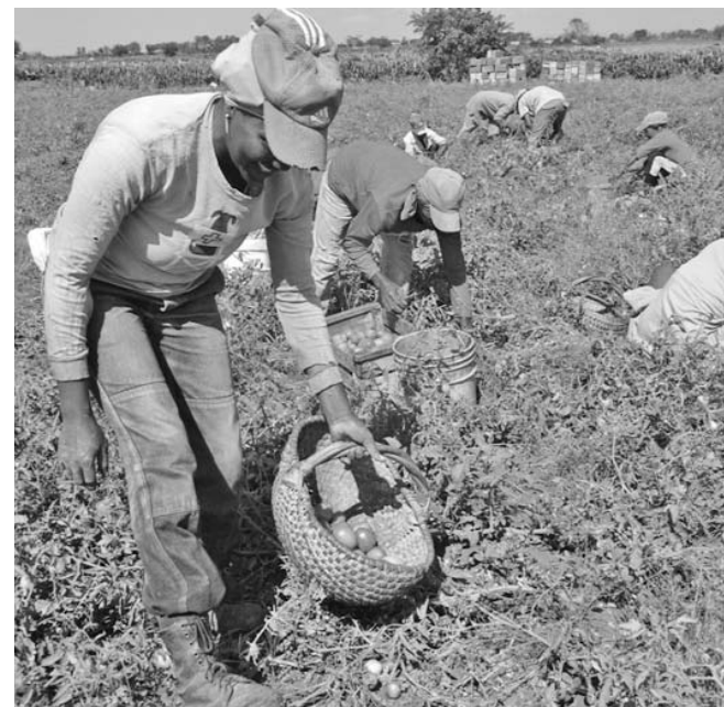
La cantidad actual de presidentas de cooperativas en Guantánamo supera la cifra del 2012.

De acuerdo con el trabajo realizado por las comisiones de candidatura el proceso de balance en la base debe concluir con