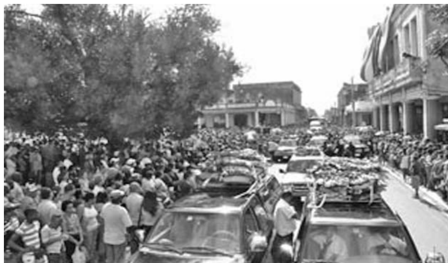
El pueblo desbordó las calles de la ciudad acompañando al cortejo fúnebre.

"Con vistas al Campeonato Mundial de Moscú, del 10 al 18 de agosto próximo, quisiera incluirme en la nómina cubana y quedar entre las ocho primeras", apunta la discóbola. Sin dudas un excelente termómetro para demostrar realmente su valía.