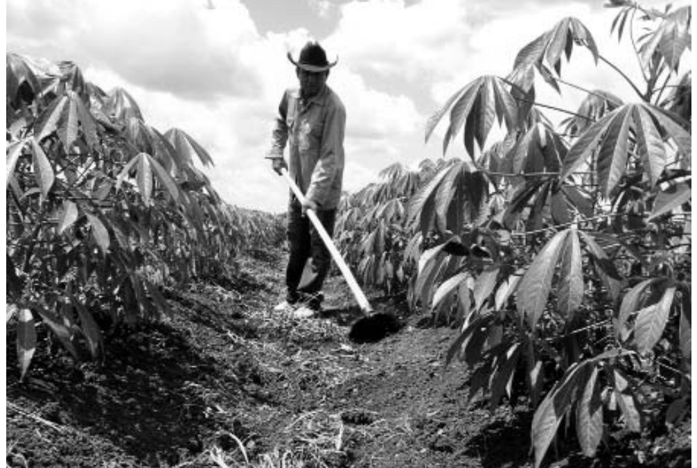
Recibir tierra implica el compromiso de mantenerla así: en franca y provechosa explotación.

La realidad del día a día revela que tales