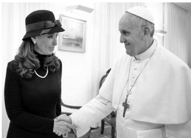
La mandataria argentina, Cristina Fernández, y el Papa Francisco durante el encuentro de este lunes.

Los cinco ministros permanecen detenidos en un campo situado a 185 kilómetros de la capital.