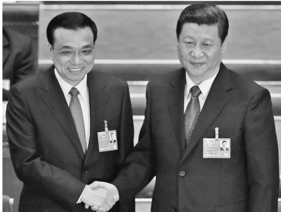
De derecha a izquierda, Xi Jinping, presidente, y Li Keqiang, primer ministro de China.

El Parlamento aprobó, además, el presupuesto para el 2013 y un plan de reformas encaminado a disminuir el protagonismo del Estado en la actividad socioeconómica y empresarial del país, redistribuyendo sus responsabilidades administrativas de una forma más razonable y eliminando probables vías de corrupción.