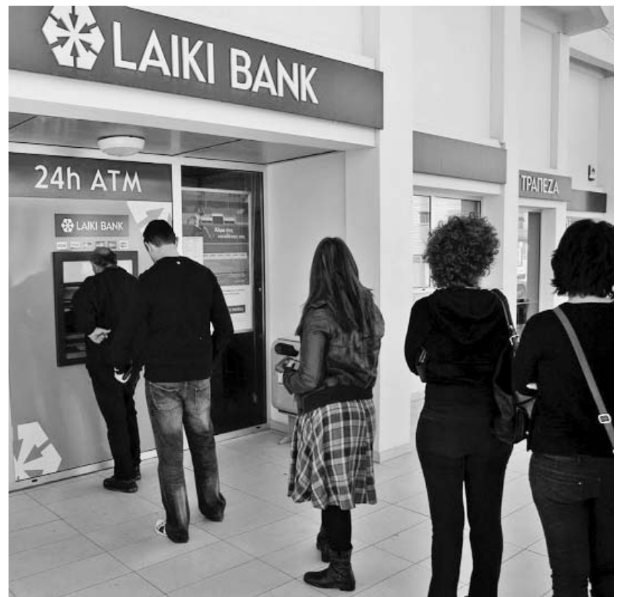
Muchos ahorristas intentan sacar su dinero antes de que entre en vigor el gravamen. Sin embargo, los bancos mantienen retenido una parte de los fondos.

De cualquier manera, el precedente de este "corralito a la europea" abriría una Caja de Pandora en la UE, a pesar de que Chipre es la tercera economía más pequeña de la eurozona. Los ahorristas de otros países rescatados como Irlanda, Portugal, España y Grecia comienzan a temer acciones similares por parte de sus gobiernos, con consecuencias infinitamente superiores dado el tamaño de las economías continentales. Y no es que el capital necesite mucho más que preocupación para emigrar. (SE)