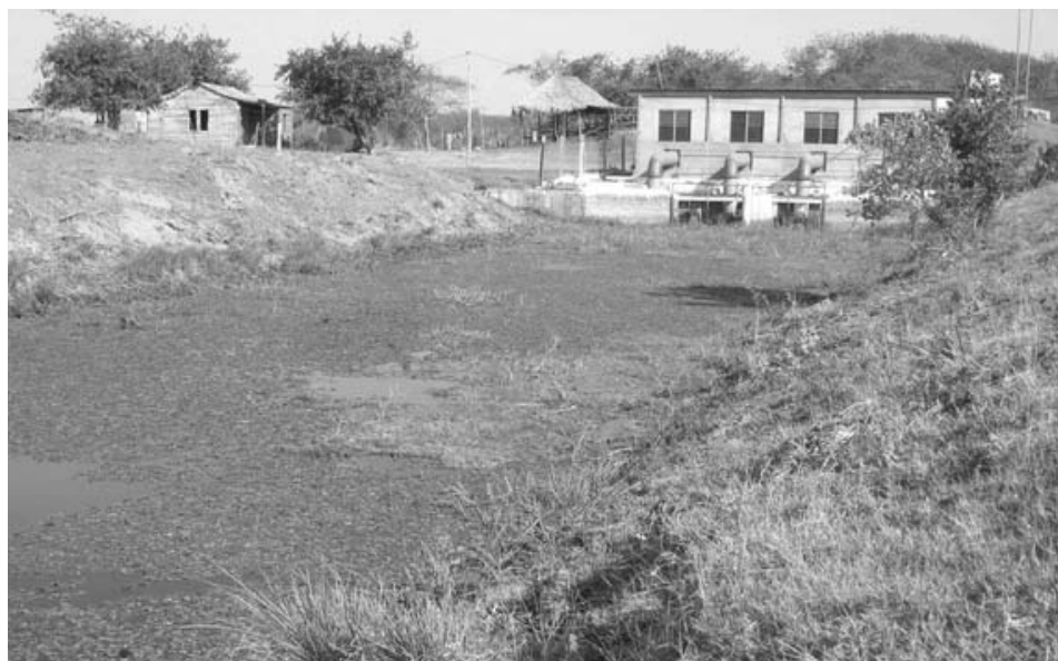
La recuperación de la estación de bombeo de Roura y sus canales imprimirán un nuevo impulso a la producción agrícola en Camalote.

Fruto de la cooperación interempresarial y del esfuerzo de los pobladores, esta zona de fuerte arraigo campesino rescata poco a poco su potencial productivo