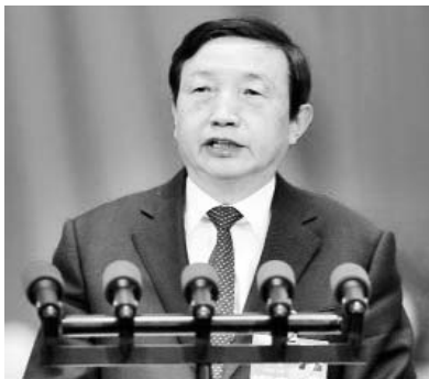
Ma Kai, secretario general del Consejo de Estado de China.

Otros cambios propuestos son elevar al rango de administración general o ministerios la actual