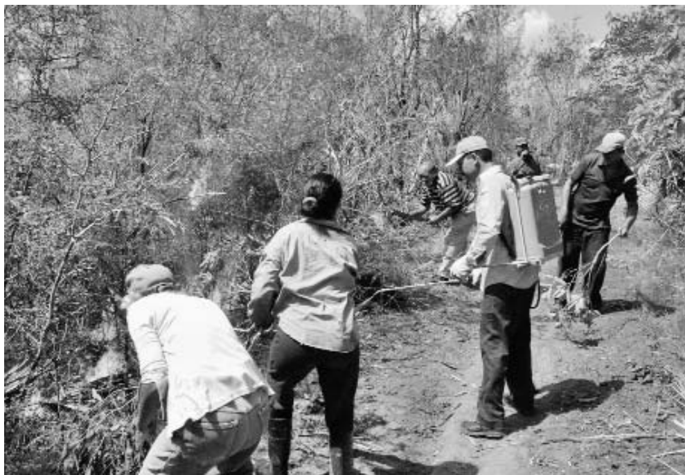
Sofocación de un incendio forestal en Cienfuegos.

Se trata de un trabajo serio y sistemático el desarrollado en estas tres provincias, que refleja, por extensión, el acometido en el resto del país: más preparado que nunca para prevenir o contrarrestar estos desastres.