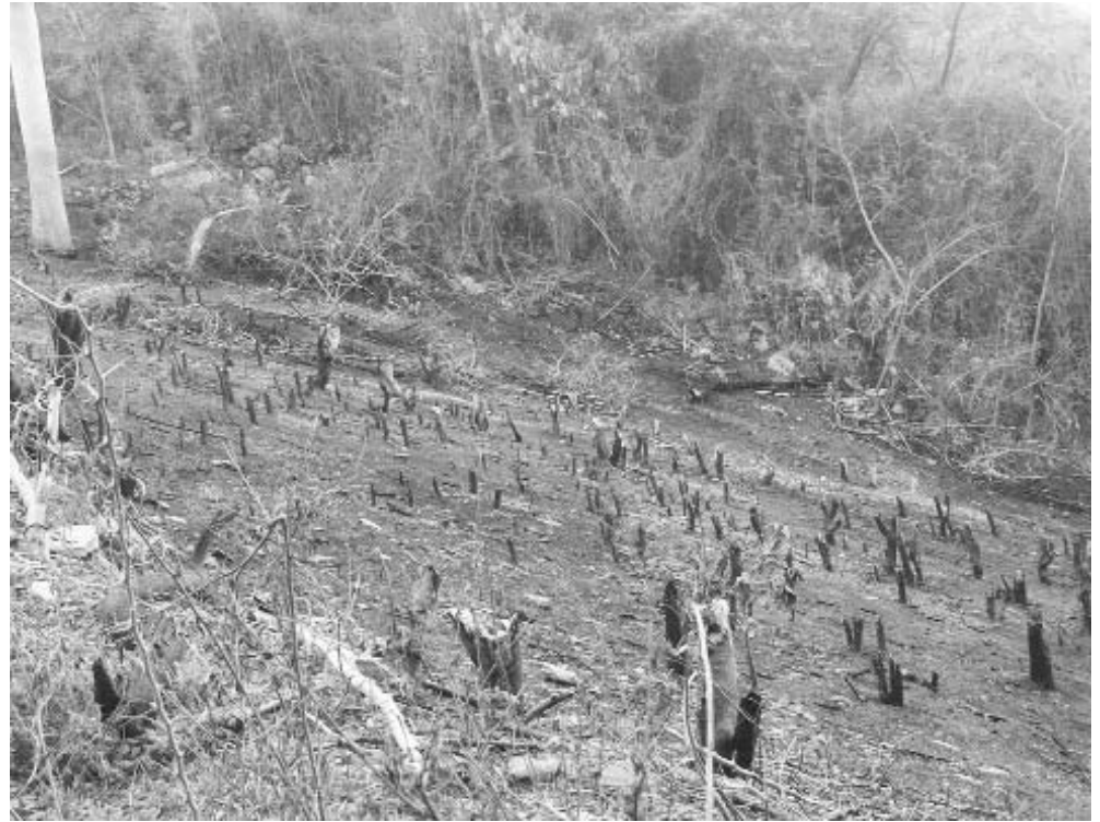
Estos desastres provocan daños ecológicos y económicos.

El quehacer ha estado dirigido a desterrar de cuajo cualquier baja percepción de los riesgos de realizar quemas en