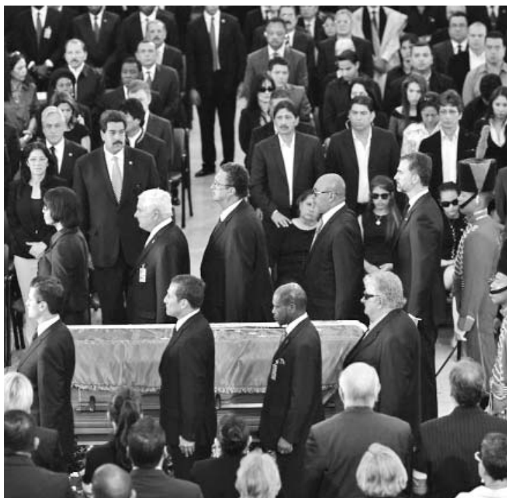
El presidente de México, Enrique Peña Nieto; de Perú, Ollanta Humala; de Surinam, Desiré Delano Bouterse; de Uruguay, José Mujica; la primera ministra de Jamaica, Portia Simpson-Miller; de Panamá, el presidente Ricardo Martinelly; los primeros ministros de Saint Kitts y Nevis, Denzil Douglas; de Santa Lucía, Kenneth Anthony, y el Príncipe Felipe de Borbón, en representación de España.