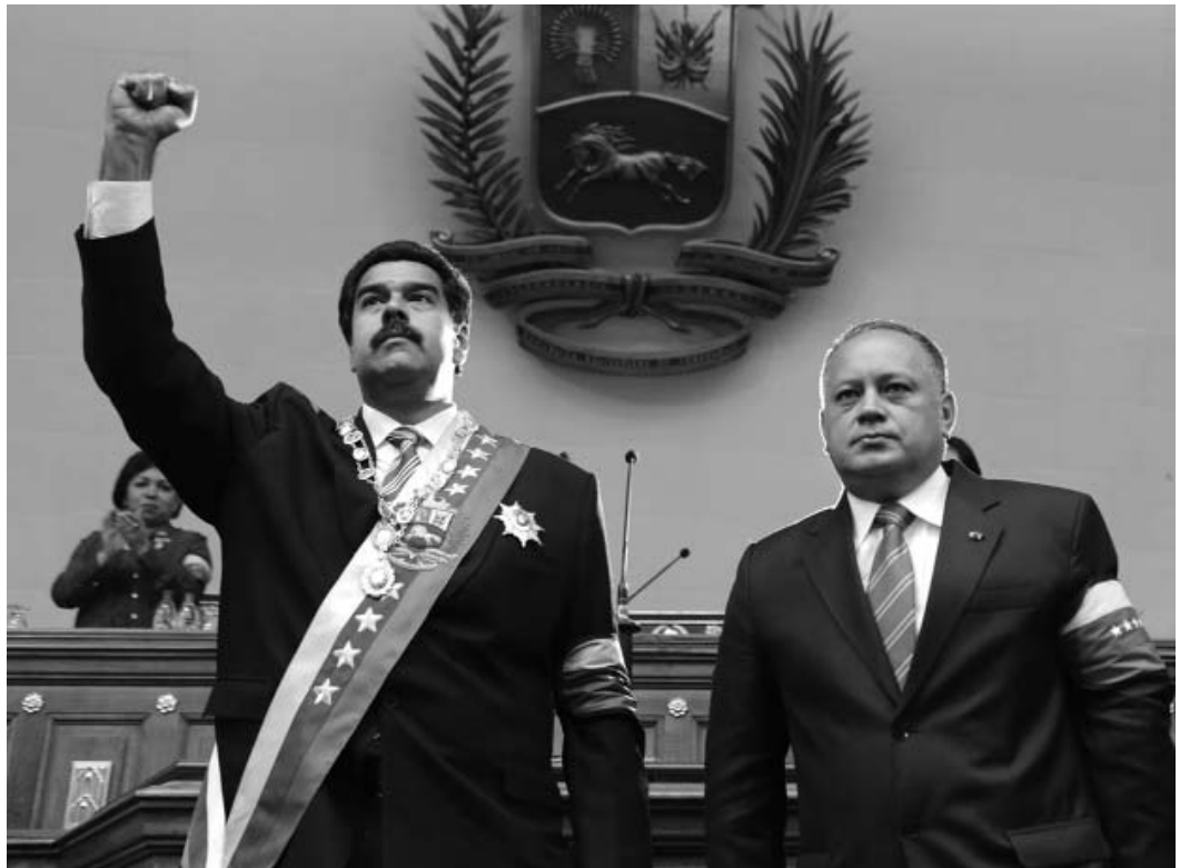
El Presidente Encargado de Venezuela, Nicolás Maduro, y el presidente del Parlamento, Diosdado Cabello.