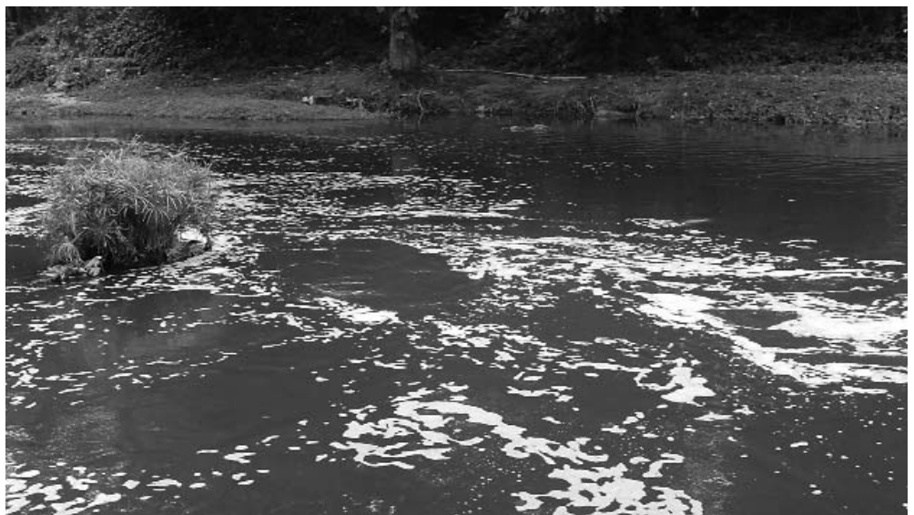
Todavía el río Almendares recibe una elevada carga de desechos contaminantes sin tratar.