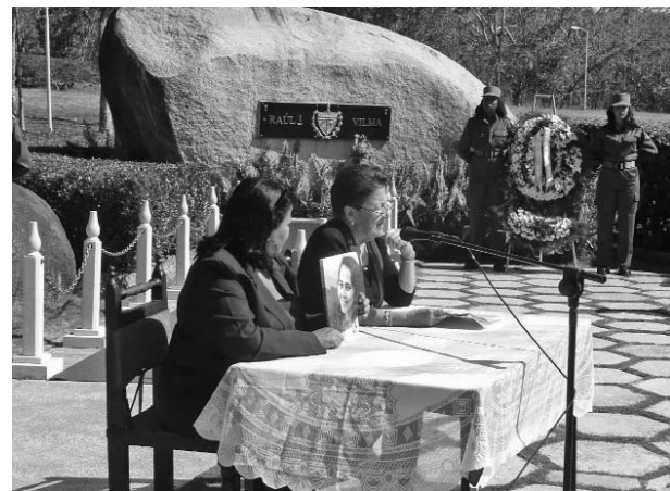
Entre las páginas del libro Vilma, una vida extraordinaria , Yolanda Ferrer destacó su incorporación al Segundo Frente al lado de Raúl.

Una ofrenda floral dedicada a Vilma en nombre de las mujeres cubanas fue deposita-