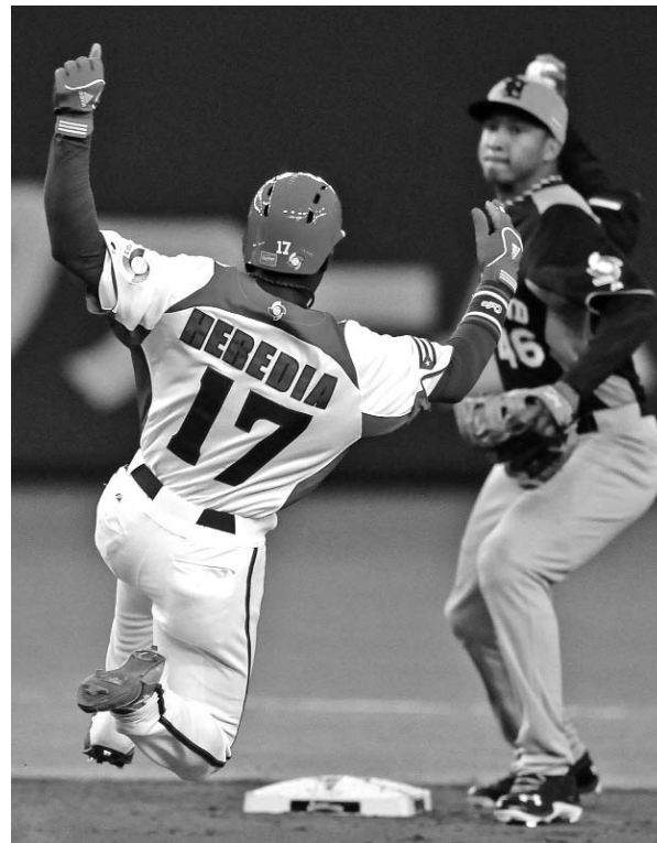
La defensa holandesa realizó cinco dobles matanzas frente a Cuba.

Ambas escuadras produjeron más que sus rivales y pudieron salir victoriosas echando por tierra lo ocurrido anteriormente, para darles, con su calidad, un golpe a los pronósticos. El