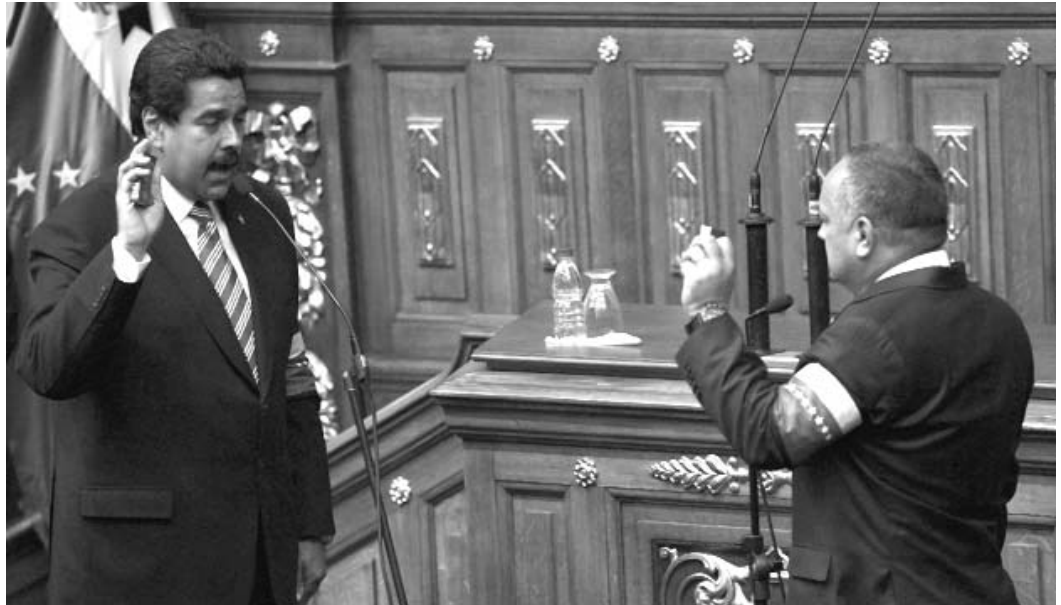
Momentos de la juramentación de Maduro.

En su discurso de investidura aseguró que en Venezuela "la columna central de la paz está en las fuerzas revolucionarias", por lo que exhortó al pueblo a no caer en las provocaciones de la derecha. "No se deje provocar nadie por la respuesta temprana, iracunda y fuera de base de algunos pequeños sectores que han salido hoy a enloquecerse, otra vez, en medio