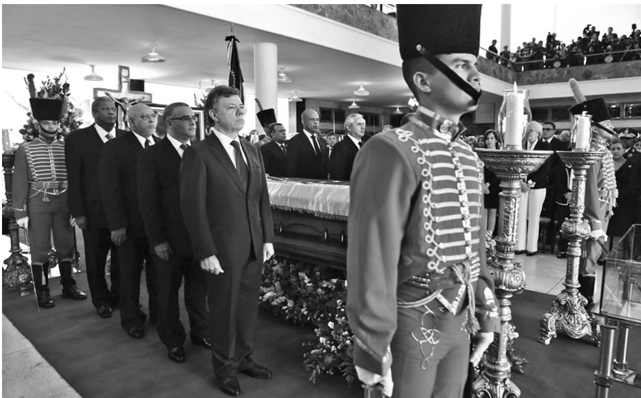
Juan Manuel Santos, presidente de Colombia; Danilo Medina, de República Dominicana; Mauricio Funes, de El Salvador; Otto Pérez, de Guatemala; Donald Ramotar, de Guyana; Michel Martelly, de Haití; y el primer ministro de Antigua y Barbuda, Winston Baldwin Spencer y el presidente de Honduras, Porfirio Lobo, durante la Guardia de Honor a Hugo Chávez.