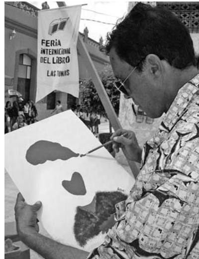
Chávez, del pincel de Antoms.

Ir por libros y retornar —además— con una “foto en trazos”, fue algo que acaparó la atención de cientos de cubanos cada día en el