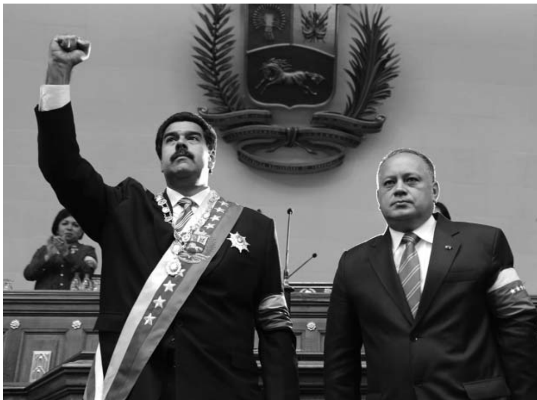
El Presidente Encargado de Venezuela, Nicolás Maduro, y el presidente del Parlamento, Diosdado Cabello.