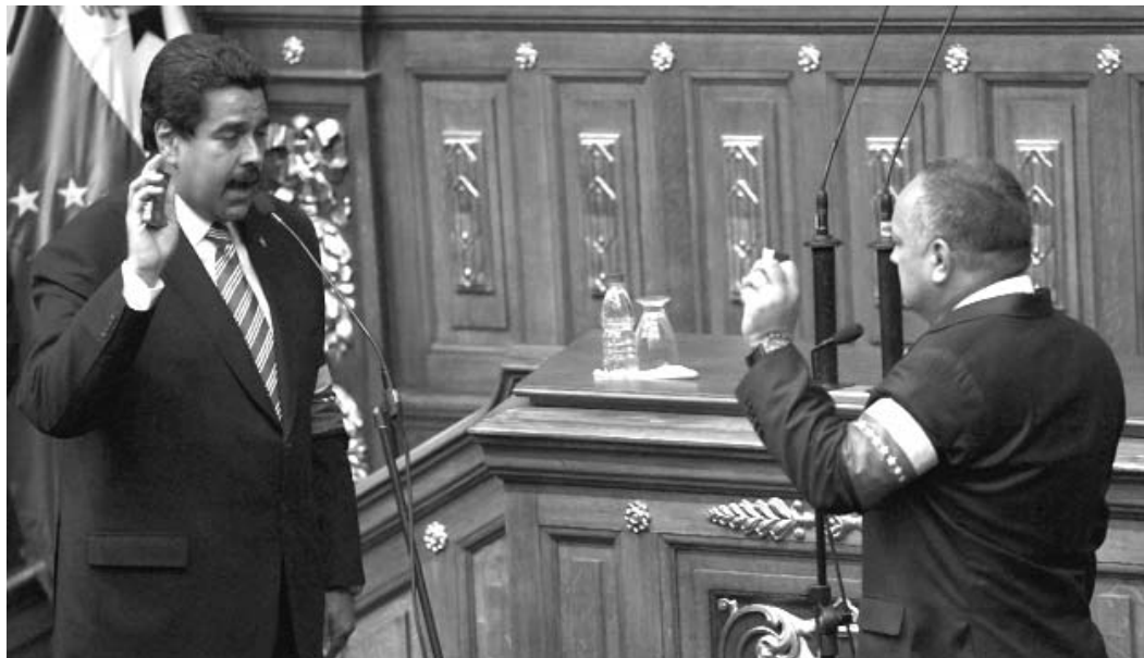
Momentos de la juramentación de Maduro.

En su discurso de investidura aseguró que en Venezuela "la columna central de la paz está en las fuerzas revolucionarias", por lo que exhortó al pueblo a no caer en las provocaciones de la derecha. "No se deje provocar nadie por la respuesta temprana, iracunda y fuera de base de algunos pequeños sectores que han salido hoy a enloquecerse, otra vez, en medio