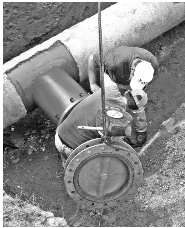
Cada nueva conexión de los conductos exige una buena dosis de exquisitez y precisión.