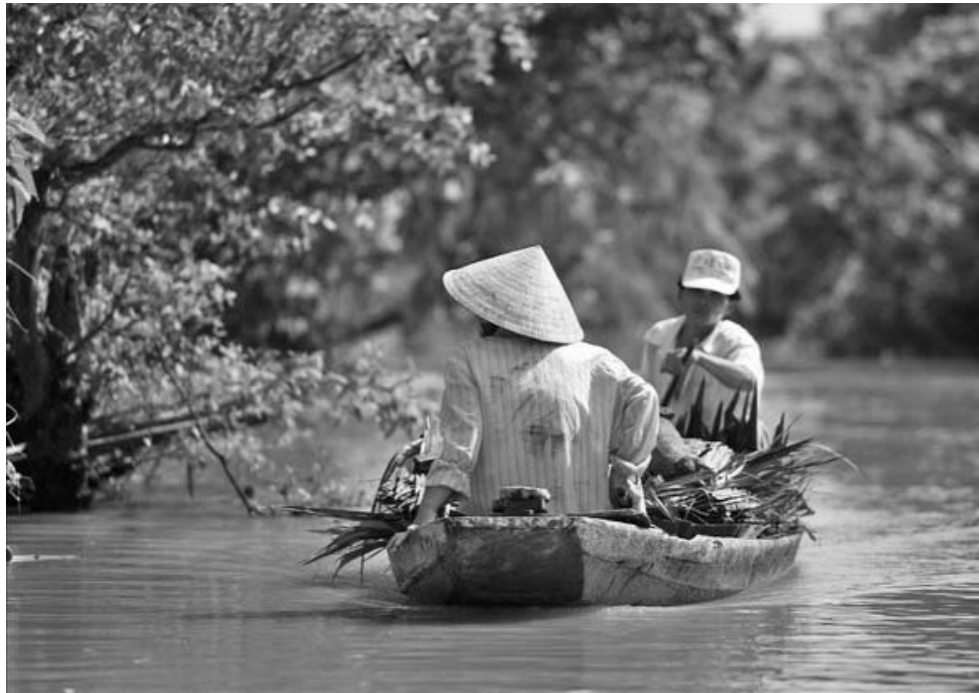
El programa de reducción de la pobreza en Vietnam prioriza las comunidades cercanas al río Mekong.

También se han llevado a cabo proyectos de desarrollo local, como el realizado entre el 2002 y el 2007 en la región montañosa septentrional, gracias al cual se beneficiaron 368 comunas en seis provincias con la edificación de nuevos caminos