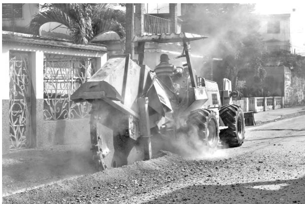
Metro a metro avanzan las brigadas en el trazado de los conductos y redes que mejorarán el servicio de agua a la población.

222,5 kilómetros de redes y tuberías, para beneficiar a más de 145 mil habitantes, buena parte de los cuales perciben una notable mejoría en la cantidad y calidad del servicio que se les ofrece y otros lo reciben por primera vez”.