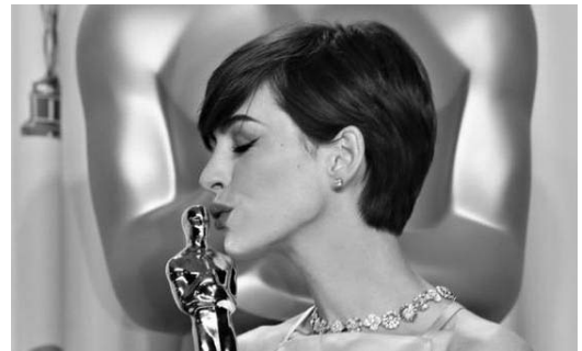
Anne Hathaway, mejor actriz secundaria por Los miserables.

quien todos esperaban, Daniel Day Lewis, por Lincoln , de Steven Spielberg, una cinta que fue perdiendo fuerza por el camino y finalmente solo obtuvo dos premios, el de Lewis y el correspondiente al mejor diseño de producción. El Oscar de actuación femenina correspondió a la nueva revelación del cine norteamericano, Jennifer Lawrence, por su desempeño en El lado bueno de las cosas .