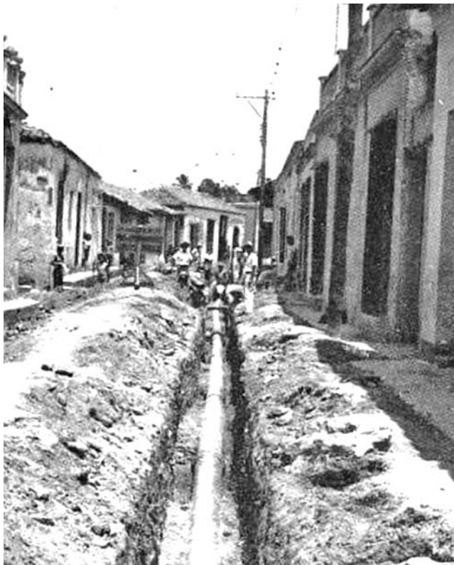
Foto histórica de la ampliación del acueducto de Camagüey acometida en 1947.

“Desde el 2007, informa Euclides, se han instalado