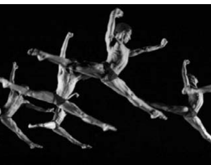
DCC repondrá la pieza Compás los tres primeros días de marzo en el Teatro Mella de La Habana.

Además tuvimos la posibilidad —explicó más adelante— de que el mismo Linkens estuviera presente