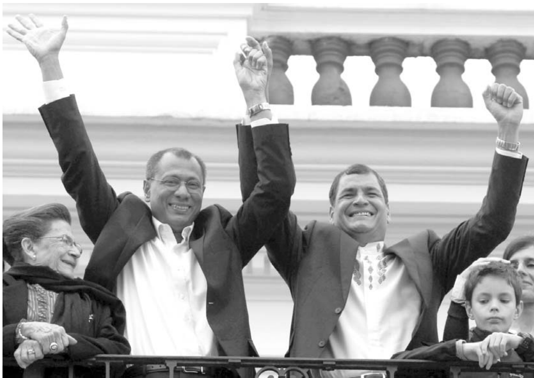
El presidente ecuatoriano Rafael Correa (derecha), celebra la victoria electoral junto a su compañero de fórmula, Jorge Glas.

Correa, quien presidirá por los próximos cuatro años, es el primer Mandatario ecuatoriano que en 12 años culmina su periodo de Gobierno sin una interrupción constitucional, pese a que en el