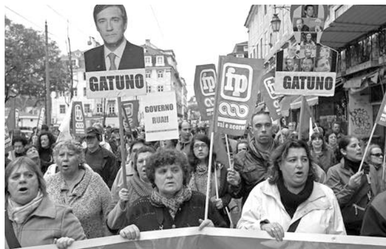
Imágenes de una de las protestas en Lisboa.

MADRID, 17 de febrero.— Importantes ciudades a lo largo y ancho de la Península Ibérica vivieron durante este domingo fuertes protestas contra los recortes promovidos por los gobiernos de Portugal y España, así como en rechazo a la destrucción de los servicios públicos.