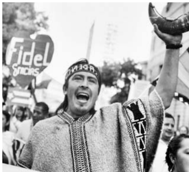
Momentos de la marcha de la Cumbre de los Pueblos.

La Cumbre fundacional de la CELAC tuvo lugar en diciembre del 2011 en Caracas, Venezuela. En cuanto a la cita de la CELAC y la UE es la primera vez que Am rica Latina y el Caribe se encuentran con una sola voz con Europa.