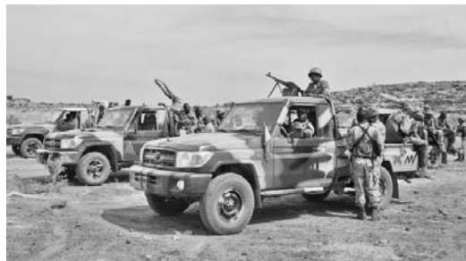
Tropas interafricanas en Mali.

Más de 2 300 soldados franceses se encuentran en estos momentos en Mali, a los cuales se suman, desde mediados de semana, parte del contingente interafricano aprobado por la ONU, que apoyará al Gobierno de Mali en la reconquista de los territorios ocupados por las fuerzas antiguubernamentales.