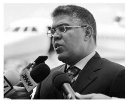
El canciller venezolano, Elías Jaua, destacó el compromiso de su país con la integración.