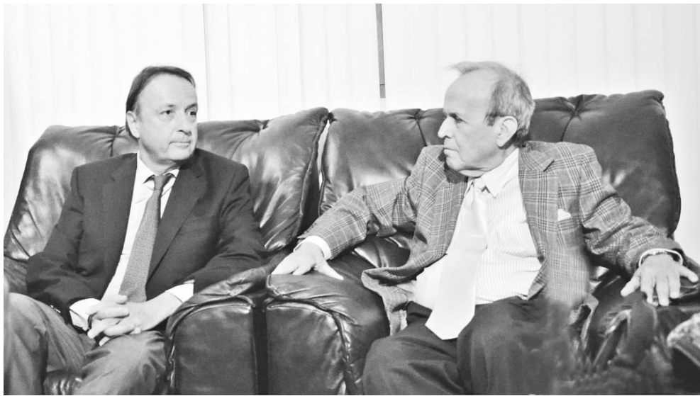
El presidente del Senado francés, Jean-Pierre Bel (izquierda), junto a Ricardo Alarcón, presidente de la Asamblea Nacional del Poder Popular.