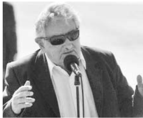
El presidente uruguayo, José Mujica, a su llegada a Chile este viernes.