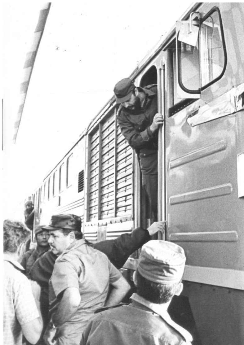
Como otro momento histórico señalamos que Fidel ese día operó la máquina tractora M-62-K No. 61602 de fabricación soviética en el primer tramo de vía inaugurado. En primer plano, el compañero Lusson.

Ahora en el año que se cumplen 40 años del XIII Congreso la CTC se ha convocado al XX Congreso y estamos seguros que los trabajadores ferroviarios