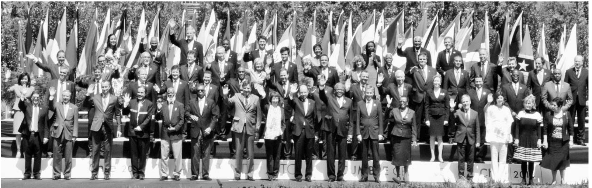
Foto oficial de los Ministros de Relaciones Exteriores de la CELAC y la UE.