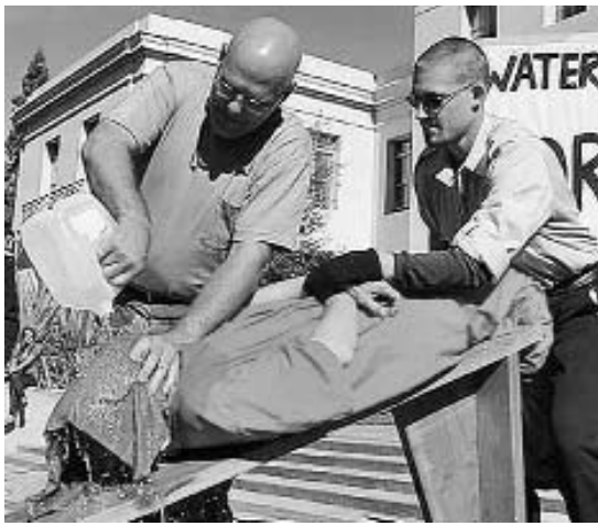
Método de tortura conocido como "el ahogamiento"