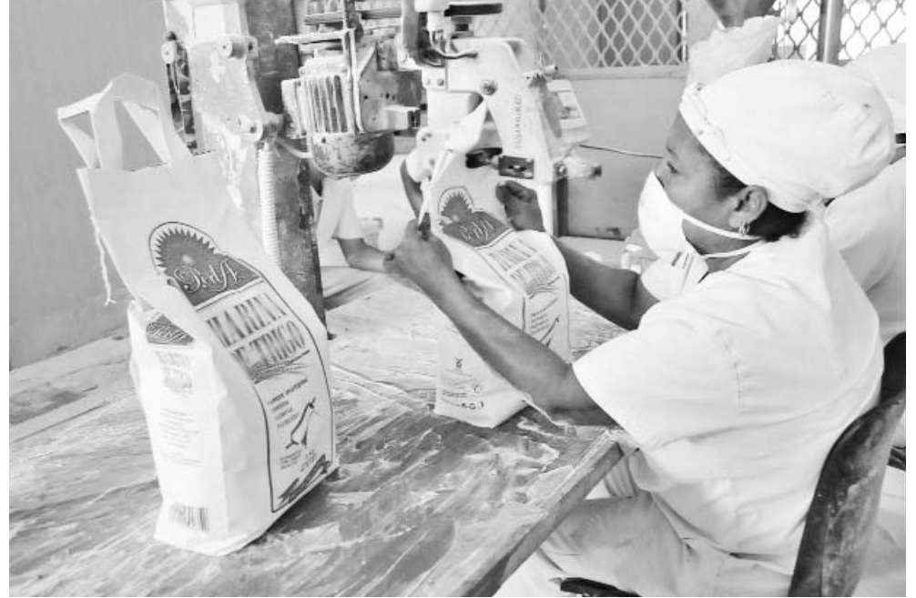
La empresa cienfueguera produce bolsas de harina de diferentes capacidades.