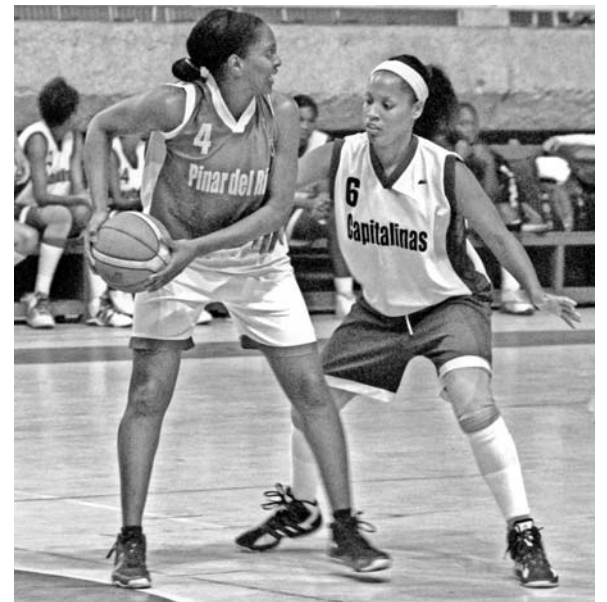
Pese al empuje de las Capitalinas, Pinar consiguió barrer como visitante.

Subseries que inician hoy: (F): VCL-CAP, PRI-CMG, SCU-SSP, GTM-MET. (M): VCL-CAP, ART-CMG, SCU-CAV, GTM-MTZ.