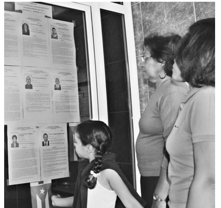
La biografía en lugares públicos, con sus méritos y virtudes, es la principal campaña de los candidatos.