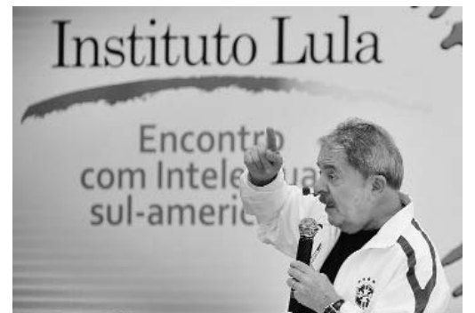
El expresidente brasileño Luiz Inácio Lula da Silva en el encuentro de hoy.

Por su parte, el exministro de Economía y actual embajador argentino en Francia, Aldo Ferrer, destacó que la región "nunca