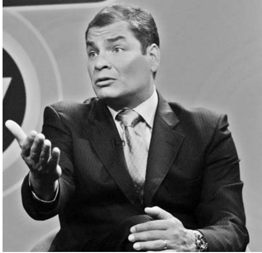
El Presidente ecuatoriano en una foto de archivo.

Guantánamo (territorio ocupado en Cuba en contra de las leyes internacionales y la opinión de su pueblo), torturan todavía y no pasa nada. Con los drones (aviones no tripulados) cometen asesinatos selectivos, y no pasa nada".