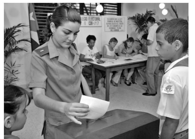
Tienen derecho al voto los cubanos que hayan cumplido 16 años, excepto los incapacitados mentales previa declaración judicial de su incapacidad y los incapacitados judicialmente por causa de delitos. Los miembros de los institutos armados pueden elegir y ser electos.