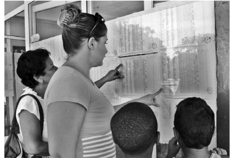
La inscripción de los electores en el registro electoral es universal, automática y gratuita.