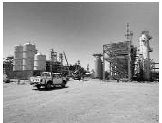
La planta de gas de In Amenas.

Según los datos provisionales, los operativos permitieron liberar 792 personas, 107 de ellas extranjeros. Entretanto, el número de fallecidos, aún sin confirmar, podría ser