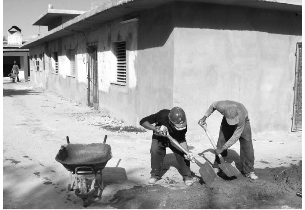
En algunas áreas la reparación es muy amplia.

"Ellos y sus familiares —agrega— están conscientes de la importancia de la tarea que cumplen en el rescate de los hospitales de la provincia y lo hacen con prontitud y calidad,