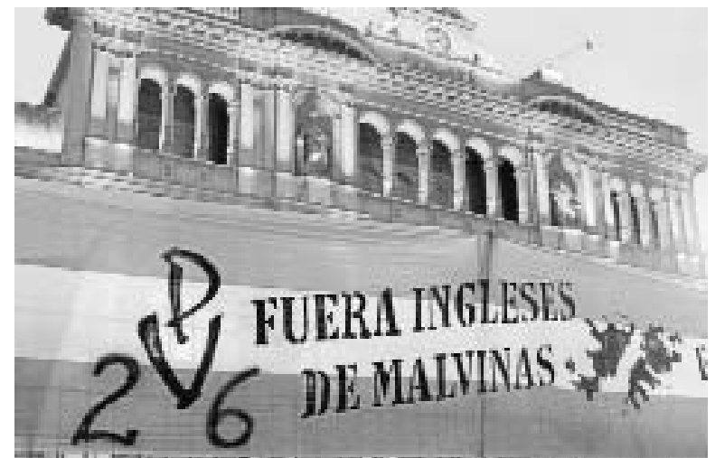
Una pancarta en Buenos Aires contra los ocupantes ingleses de las Malvinas.

Argentina, aseguró Boudou, “seguirá pidiendo en paz, pero con toda la fuerza”, sentarse a dialogar sobre la soberanía de las Malvinas, interrumpida hace 180 años por el acto beligerante de fuerzas británicas que expulsaron a las autoridades y población argentinas, reemplazándolas por ciudadanos de la nación europea.