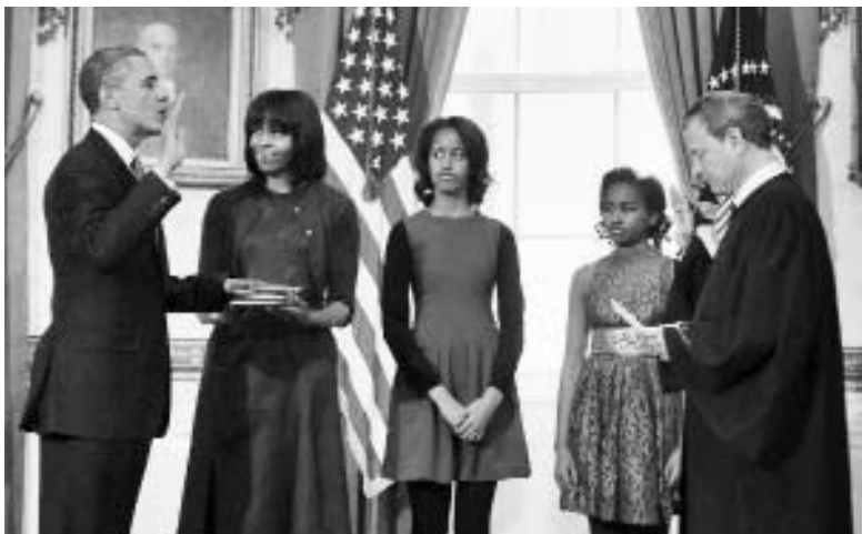
Obama (izquierda) toma juramento junto a su familia y un Juez de la Corte Suprema.

Los problemas económicos, el desempleo, guerras aún sin concluir y el cumplimiento de sus promesas de gobierno referentes a los inmigrantes, los impuestos y la protección social, son solo algunos de los difíciles retos que tendrá por delante el reelecto mandatario.