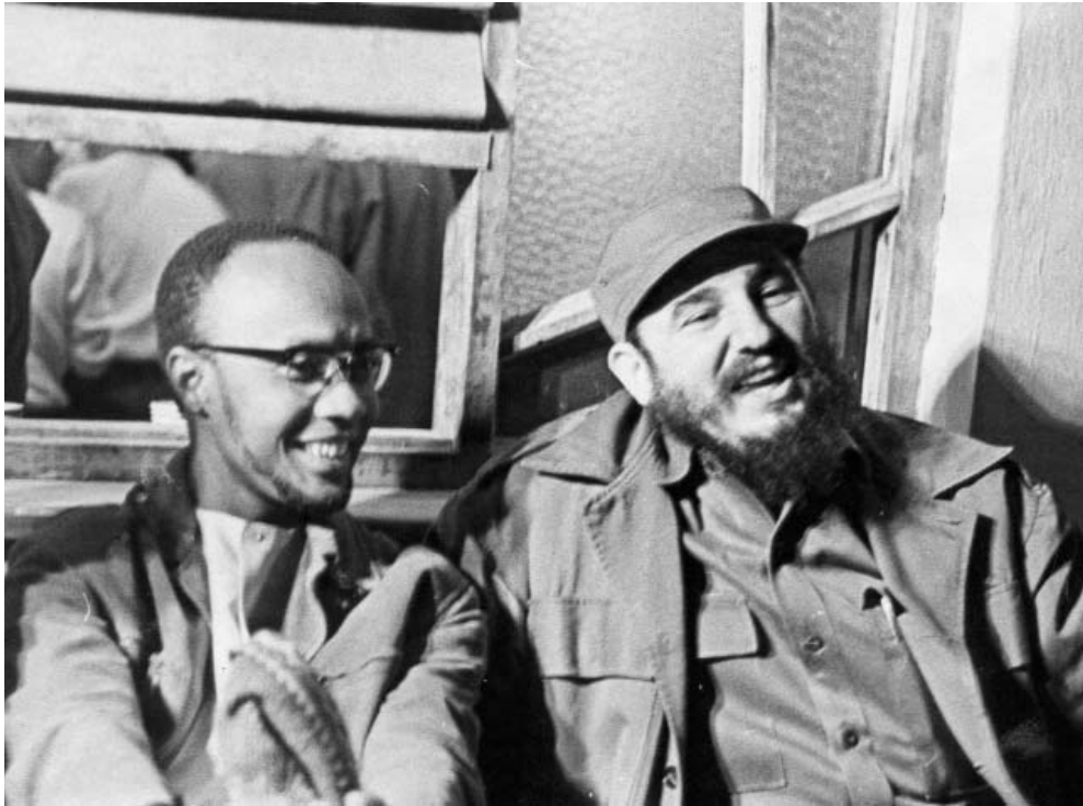
Amílcar Cabral junto a Fidel en Cuba, en una foto de 1966.

La presencia portuguesa jamás fue aceptada de manera pacífica, de distintas formas se hizo resistencia al ocupante extranjero: primero se luchó por reformas y después por la independencia. El movimiento de liberación ganó más fuerza tras la Segunda Guerra Mundial (1939-1945).