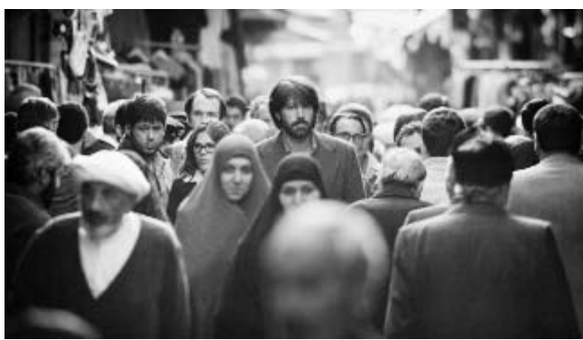
Argo , siete nominaciones al Oscar y ninguno por las mentiras.

Hubiera sido otro éxito de taquilla más y otro gato por liebre en lo concerniente a la "historia