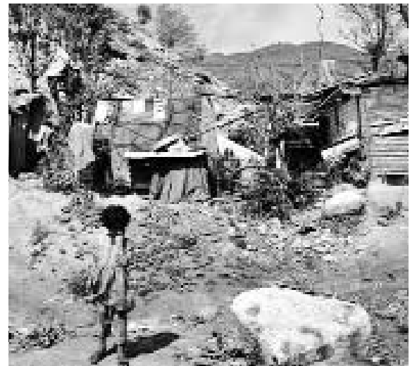
En el mundo hay cerca de 1 400 millones de personas viviendo en pobreza extrema.

“No podemos seguir fingiendo que la generación de riqueza de unos pocos beneficiará al resto”, sostuvo Vera, quien propone acabar con los paraísos fiscales que albergan cerca de 32 billones de dólares o, lo que es lo mismo, la tercera parte de la riqueza mundial.