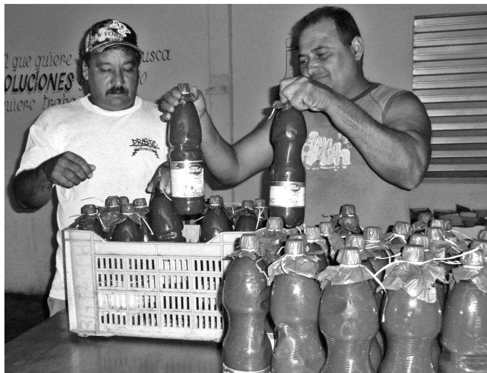
Todo indica que en la provincia las mini-industrias diseñadas para la elaboración de alimentos procesarán grandes cantidades de tomate.

No obstante, el reto de aprovechar toda la producción aparecerá en la etapa marzo-abril, cuando el pico de la cosecha sea como la clásica añadidura de leña a un fuego intenso.