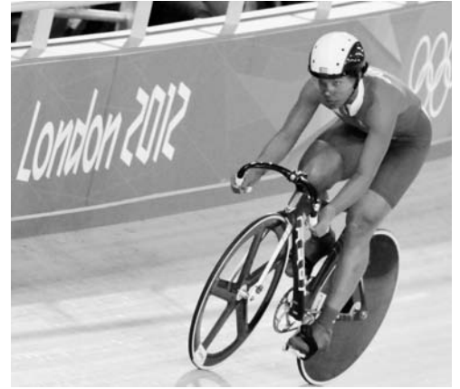
La matancera Guerra recuperó su mejor versión al conquistar la medalla de plata en la velocidad pura.

Saltando de la pista a la carretera, igual cabe destacar que el principal equipo cubano de ruta tomará hoy la arrancada en la