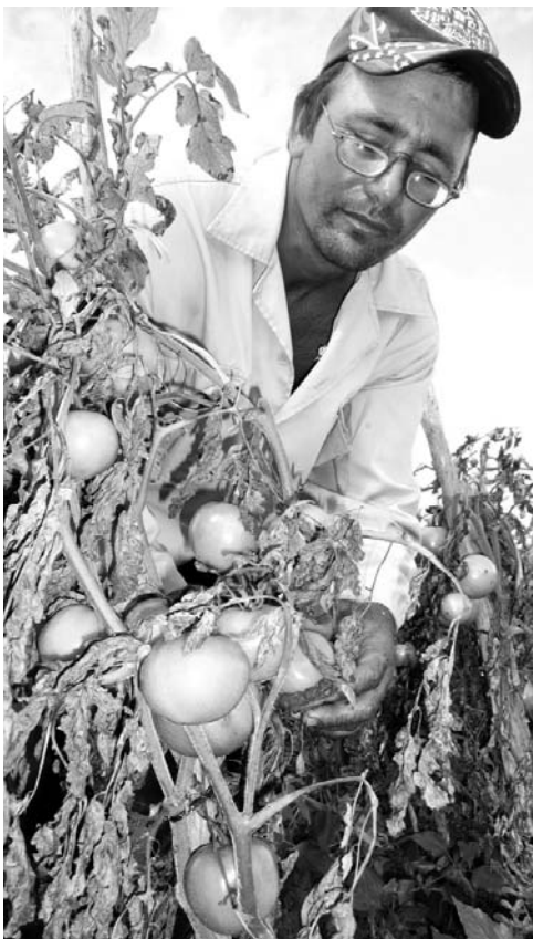
Si falla el seguimiento a la siembra no podrán ser objetivos los planes de acopio y venta.

"No obstante, nos preparamos para iniciar la molienda en los primeros días de febrero, mes en el que siempre hay tomate disponible. Ya contratamos 295 toneladas mediante pesquisas y con-