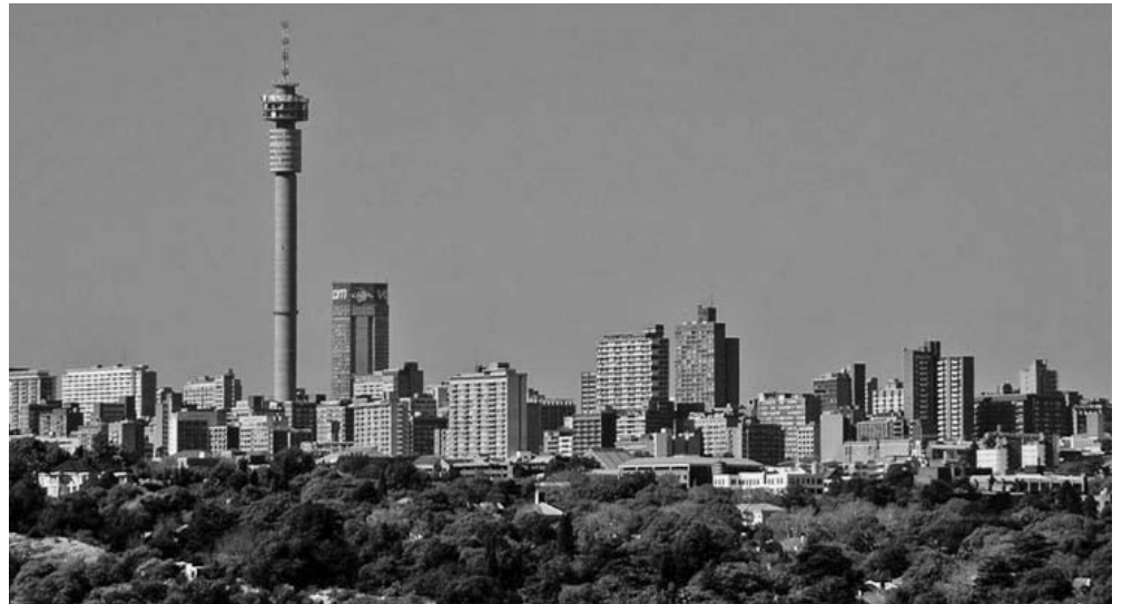
Johannesburgo es la ciudad más grande y poblada, así como el centro económico más importante.

Sudáfrica tiene un subsuelo rico en recursos minerales. Es el mayor exportador de oro y cromo, y el cuarto productor de diamantes del planeta. Produce el