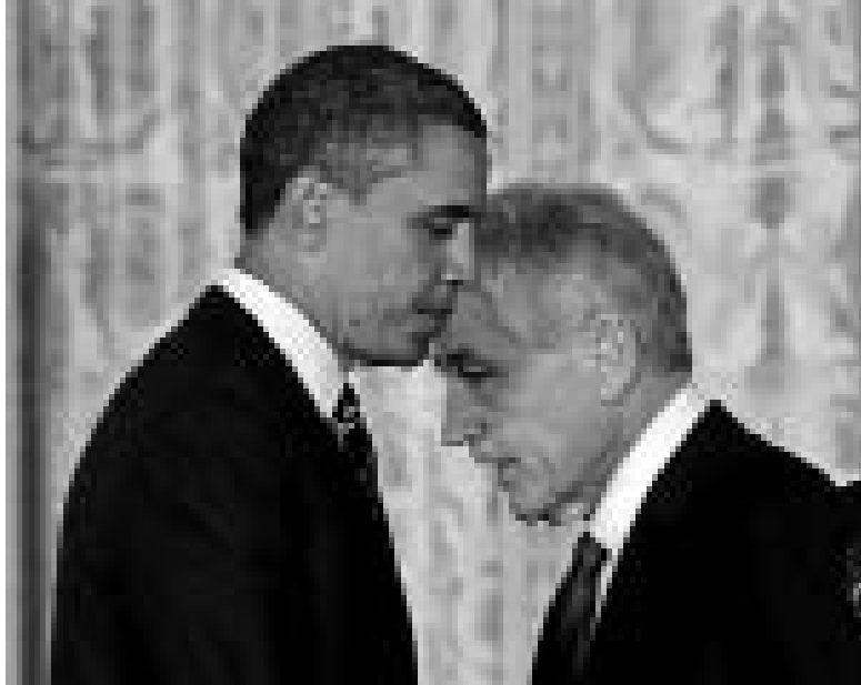
Barack Obama y Chuck Hagel.

En el 2007 fue el único senador republicano que votó a favor de una resolución presentada por el ahora vice-