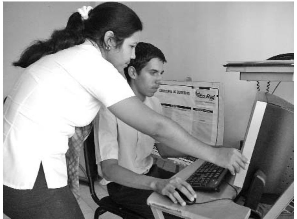
Aún muchas personas desconocen las amplias posibilidades que ofrece la red de Joven Clubs y sus Centros de Información Científico Técnica.

Con el sedimento de un cuarto de siglo ya, la red tunera busca nuevas alturas en el 2013 para continuar consolidando también la huella (no solo técnica, sino también humana) dejada por espacios a la medida de personas discapacitadas,