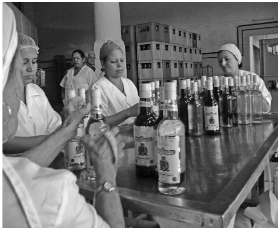
Trabajadores de la fábrica etiquetan las botellas con las nuevas versiones de los rones Cienfuegos y Jagua.

Procuran, además, la progresiva inserción en el mercado nacional (en pesos y divisa) de una variedad inédita, el Añejo Blanco Jagua —de más solera: el nivel de añejamiento de la masa en la bodega es más prolongado—, con 40 grados de