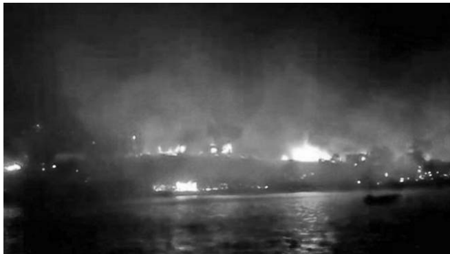
Una ola de calor ha azotado a Australia en este mes, provocando numerosos incendios forestales.

SIDNEY (Australia).—El presidente del Grupo Intergubernamental de Expertos sobre Cambio Climático de la ONU (IPCC, siglas en inglés), Rajendra Pachauri, volvió a alertar de una “inequívoca” tendencia hacia un acelerado calentamiento mundial.