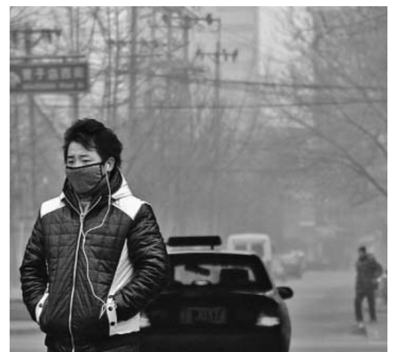
Un espesa nube de smog cubre la capital china desde hace varios días.

Las autoridades meteorológicas instan a los ciudadanos a permanecer en sus viviendas y a usar mascarillas respiratorias en caso