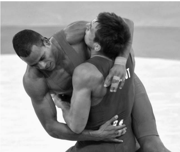
Isaac se verá nuevamente con su coterráneo Bell en el certamen doméstico.

inscritos, con el incentivo adicional de un boleto a la preselección elite (en caso de no integrarla aún) para los monarcas de cada división.