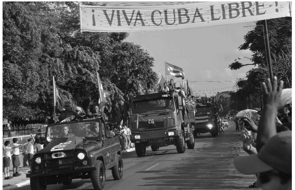
La caravana de la libertad se desplazó desde la Fábrica de Gomas Julio Antonio Mella, en el Cotorro, hasta la Cervecería Guido Pérez, en este mismo municipio.