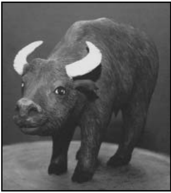
Estos ejemplares de la fauna africana están contruidos a partir de envases plásticos desechados.