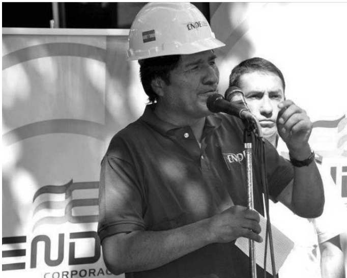
El presidente boliviano, Evo Morales, durante un discurso tras la nacionalización de las filiales de Iberdrola en diciembre pasado.