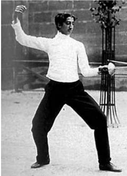
El legendario Ramón Fonst considerado entre los cien destacados por la Federación Internacional.