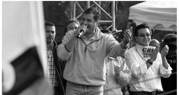
El presidente ecuatoriano Rafael Correa en un acto de campaña.

QUITO, 8 de enero.—Miles de seguidores del gubernamental Movimiento Alianza PAIS se reunieron en esta capital para respaldar al candidato a la presidencia Rafael Correa y a los diputados a la Asamblea Nacional.