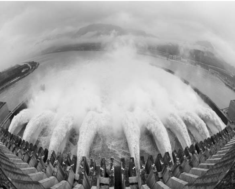
La hidroeléctrica de las Tres Gargantas de China es la mayor de su tipo en el mundo.

invernadero a la atmósfera. También se conoció este martes que Beijing prestará más atención al desarrollo de la industria biotecnológica, como una vía para enfrentar dificultades nacionales relacionadas con el crecimiento de la población, la seguridad alimentaria, la conservación energética y la protección medioambiental. De acuerdo con un comunicado del Consejo de Estado chino, el país pretende duplicar el porcentaje que representa el valor añadido de la producción del sector biotecnológico en el Producto Interno Bruto de cara al 2015, comparado con el nivel alcanzado en el 2010. Según el plan de desarrollo de la industria biotecnológica presentado por el gabinete, la producción del sector deberá aumentar a un ritmo medio anual de más del 20 % entre el 2013 y el 2015. El Gobierno mejorará, además, las capacidades tecnológicas y de innovación del sector para convertirlo en una industria pilar de cara al 2020, fecha en la que China aspira a convertirse en una sociedad moderadamente acomodada.