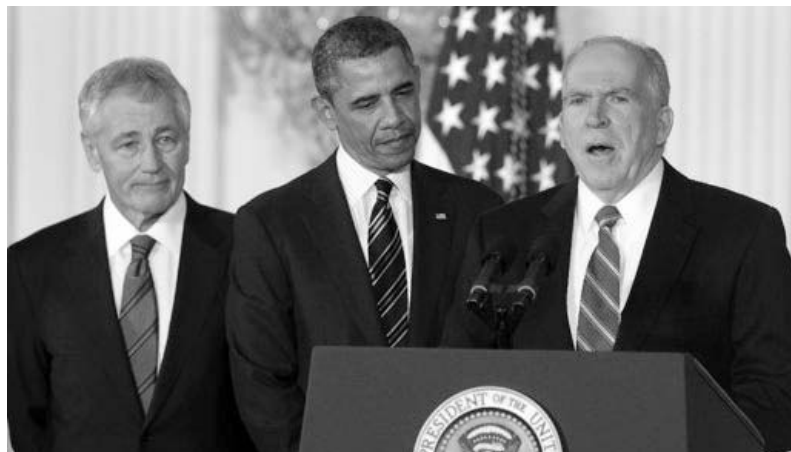
El presidente Barack Obama (centro), junto a Chuck Hagel (izquierda) y John Brennan, durante la presentación oficial.

Senador entre 1997 y el 2009, el político apoyó la ley Patriot Act (Acta Patriota) y la invasión de Iraq, pero a partir del 2005 se movió hacia una posición crítica de la ocupación y sus enfoques sobre política exterior estuvieron más cerca de los demócratas que del propio Partido Republicano.