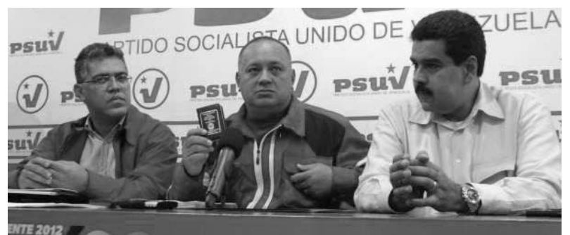
De izquierda a derecha, Elías Jaua, dirigente socialista; Diosdado Cabello, presidente del PSUV y del Parlamento, junto a Nicolás Maduro, Vicepresidente Ejecutivo, durante la rueda de prensa.

Fuentes de Carabineros citadas por el Canal 24 Horas dijeron, sin embargo, que no se había producido allanamiento alguno.