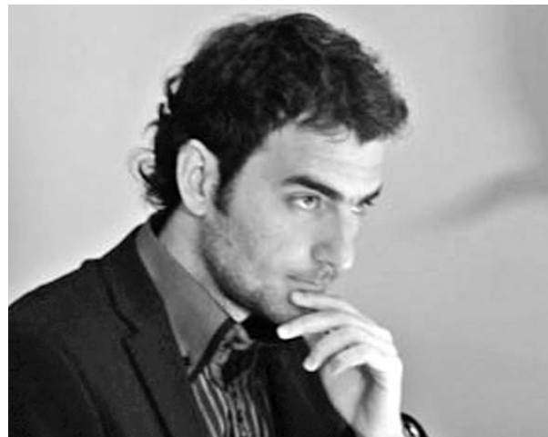
Leinier, a pesar de cierta baja, continúa como el número uno de Cuba.

1.-Magnus Carlsen (NOR) 2 861 puntos. 2.-Vladimir Kramnik (RUS) 2 810. 3.-Levon Aronian (ARM) 2 802. 4.-Teimour Radjabov (AZE) 2 793. 5.-Fabiano Caruana (ITA) 2 781. 6.-Sergey Karjakin (RUS) 2 780. 7.-Viswanathan Anand (IND) 2 772. 8.-Veselin Topalov (BUL) 2 771. 9.-Hikaru Nakamura (USA) 2 769. 10.-Shakhriyar Mamedyarov (AZE) 2 766... 25.-Leinier Domínguez (CUB) 2 723... 46.-Lázaro Bruzón (CUB) 2 701, entre los 100 primeros del mundo. (EFE)