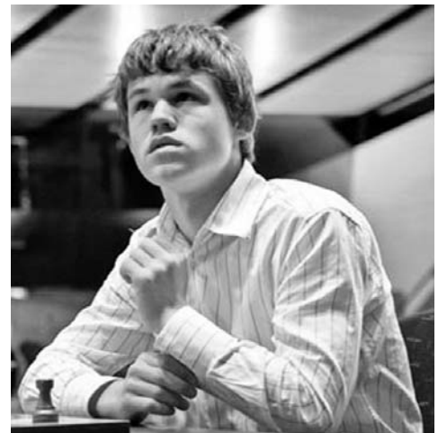
Una vez más Carlsen asombra al mundo con su talento.

Carlsen prepara ya su próximo objetivo, el Torneo de Candidatos al título mundial, que se disputará en Londres del 13 al 31 de marzo, con ocho Grandes Maestros enfrentados a doble vuelta y cuyo vencedor