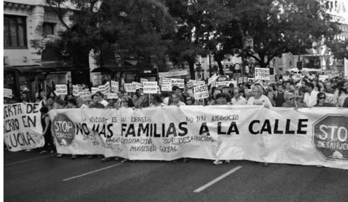
Muchos españoles se han agrupado para protestar contra los desahucios.

EFE reporta que desde el 2007 unas 400 mil familias han perdido sus viviendas por no poder pagar la hipoteca.