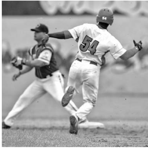
Nuevamente se agitó la grama del Palmar de Junco, ahora gracias a la intensidad de los Cocodrilos matanceros.