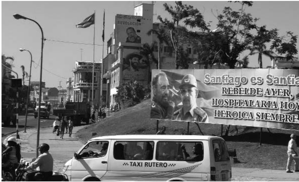
El colorido de banderas y gigantografías vuelve a las calles santiagueras.