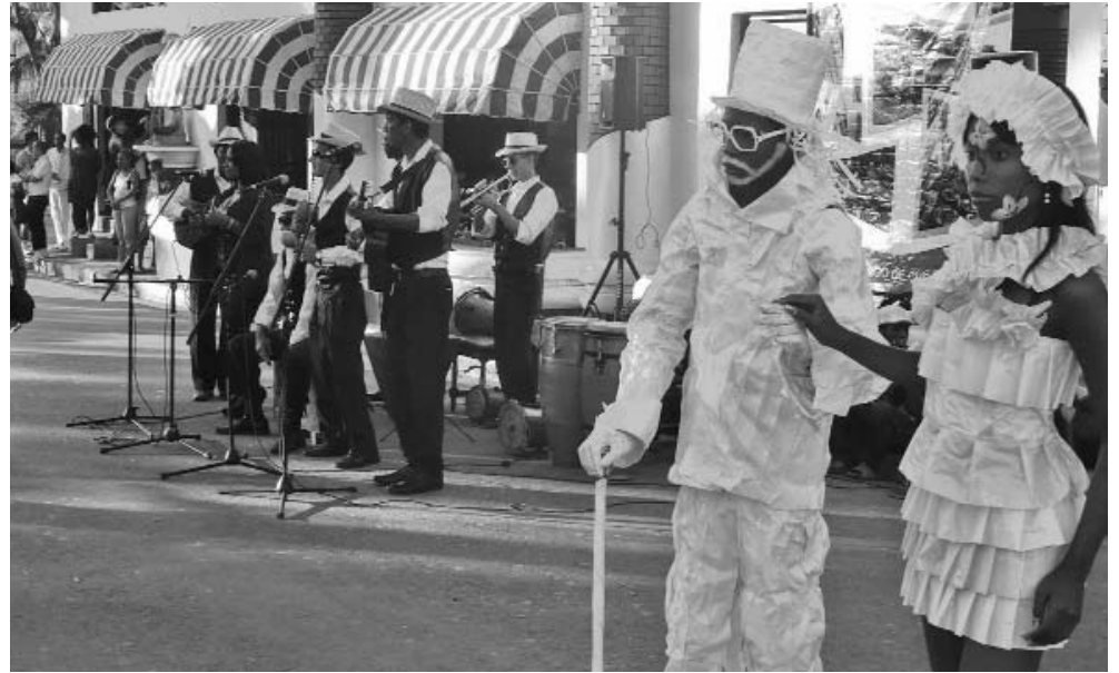
En plazas se brindan ya, diariamente, atractivas variedades culturales.