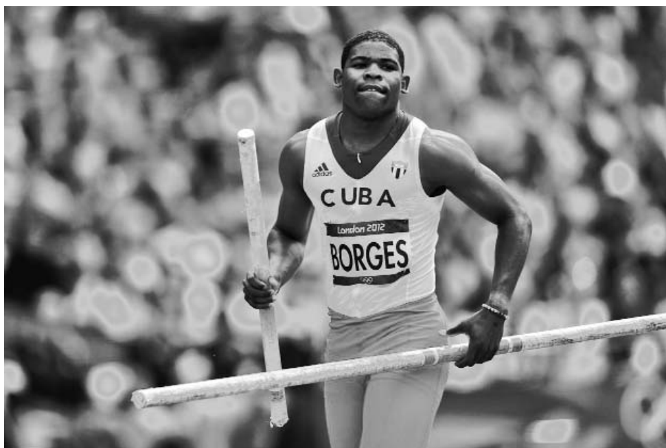
El pertiguista capitalino trabaja en función de acercarse nuevamente a su tope personal de 5.90 metros.