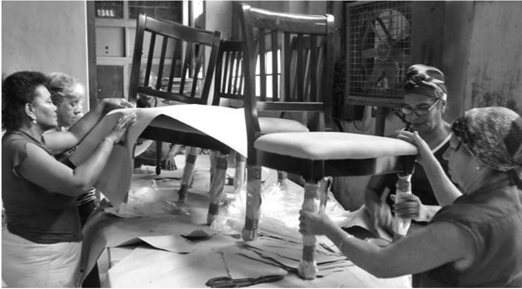
Experimentadas y diestras manos femeninas tienen a su haber el embalaje de los muebles.