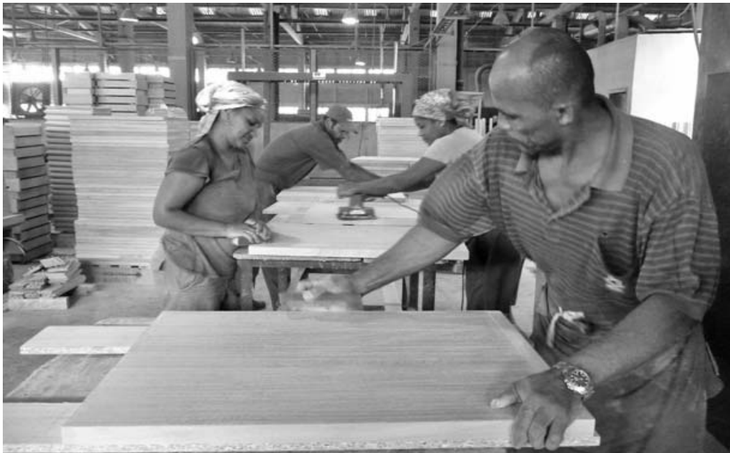
Jornadas de hasta 12 horas de labor desarrollaron los trabajadores para cumplir el plan anual de producción.