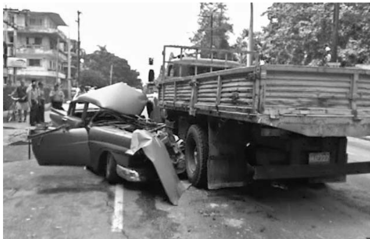
Hasta el mes de noviembre se reportaron en nuestro país 10 mil 522 accidentes viales, con el saldo de 637 fallecidos y 7 865 lesionados.

La mayor cantidad de accidentes ocurren entre o con vehículos del sector estatal. De manera especial