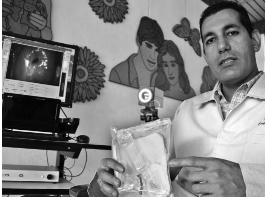
Video Colposcopio Digital SUMASCOPE para el diagnóstico precoz del cáncer cérvico uterino.

La aplicación de esta tecnología brinda beneficios sociales y económicos, al garantizar la implementación