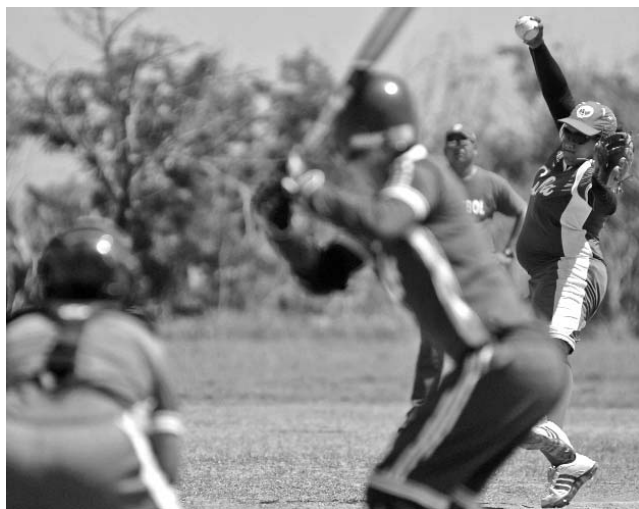
El alto rendimiento también tendrá acción durante el próximo año.

“Sería un torneo de larga duración, con fecha de inicio para febrero o marzo y culminación en noviembre o diciembre. El formato incluiría partidos de ida y vuelta, con la particularidad de que cada equipo sufraga