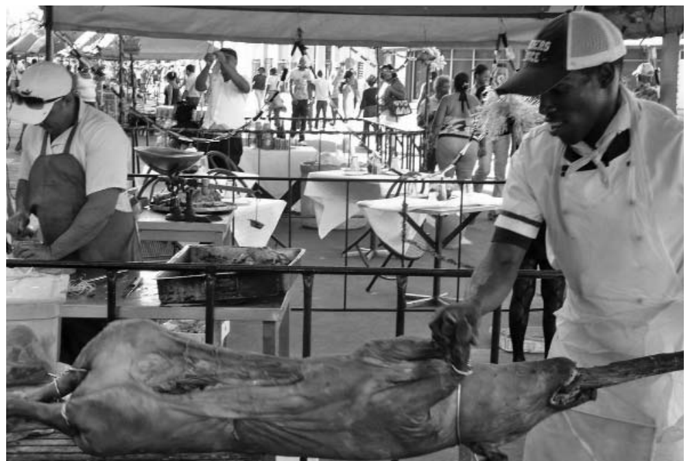
Desde la pasada semana se redoblan las ofertas.

Santiago de Cuba sienta las bases y presenta sus credenciales para celebrar el aniversario 60 del asalto al Cuartel