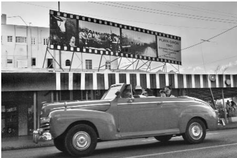
Girón 1961, en la esquina de 23 y 12.

Para Ernesto llegaron los arduos y provechosos días en el periódico Revolución y en el suplemento Lunes de Revolución . Reconocida publicación que le dio por encima de todo un valor primordial a la fotogra-