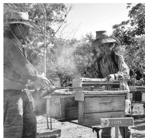
El manejo inteligente y oportuno de los apiarios ha sido factor clave en el resultado de los apicultores espirituanos.

Con una dotación de poco más de 12 mil 200 unidades repartidas en 37 CCS, dos UBPC, dos CPA y otros productores como Flora y Fauna, la provincia espirituaña logra un rendimiento superior a los 54 kilogramos por colmena, que