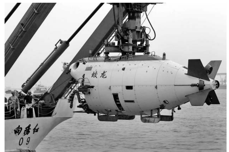
El submarino chino descendió más de siete mil metros en la Fosa de las Marianas.