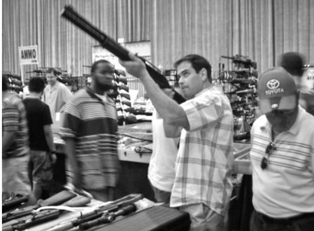
El senador de origen cubano Marco Rubio (quien sostiene la escopeta en la foto), es visto a menudo en ventas públicas de armas ( gun shows ).

Por su parte, inmediatamente después de la matan-