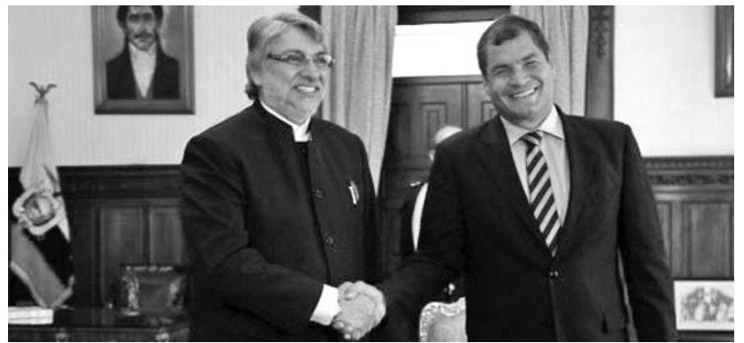
El líder del Frente Guasú paraguayo, Fernando Lugo, y el mandatario ecuatoriano Rafael Correa.

El Partido Liberal Democrático gobernó la nación nipona durante la mayor parte de la era posterior a la Segunda Guerra Mundial, antes de que fuera reemplazado hace tres años por el Partido Democrático.