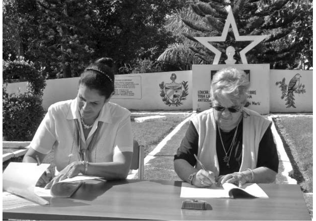
En la inauguración del encuentro se firmaron los convenios de trabajo entre el Centro Nacional de Capacitación de la ANAP, la Escuela Superior de la Agricultura Urbana y Suburbana, y la ACPA.

Sobre el encuentro puntualizó que en estas jornadas se efectuaron seminarios y conferencias en el Centro Nacional de Capacitación de la ANAP Niceto Pérez García, del artemiseño municipio de Güira de Melena, con la participación de los 32 mejores productores del movimiento en la nación, intercambios acerca de la generalización de resultados