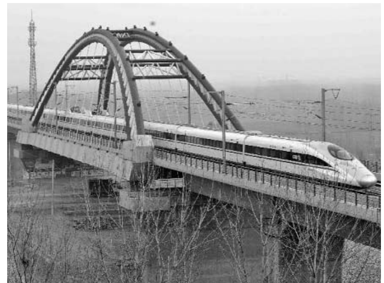
Los trenes de alta velocidad son un importante medio de transporte en China.