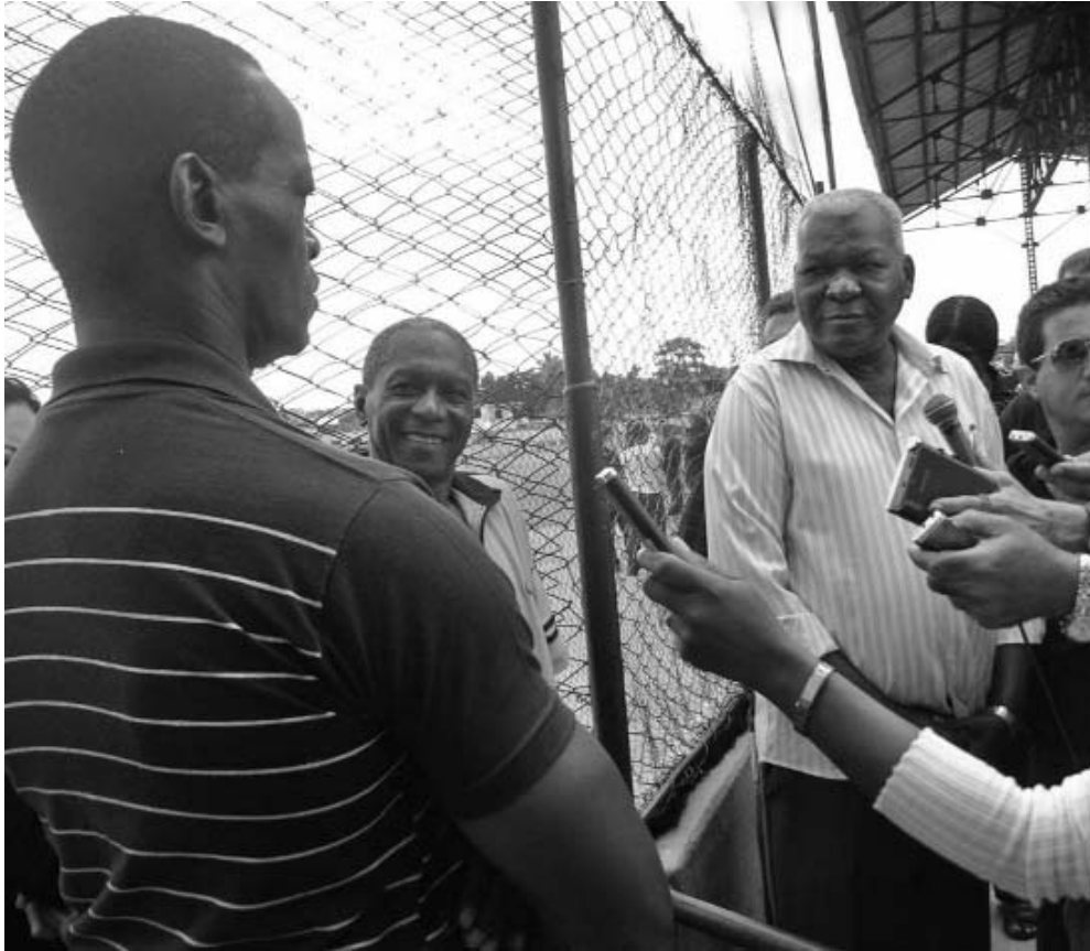
Lazo conversa con dos glorias del deporte cubano: Lázaro Junco y Félix Isasi.

ÓRGANO OFICIAL DEL COMITÉ CENTRAL DEL PARTIDO COMUNISTA DE CUBA