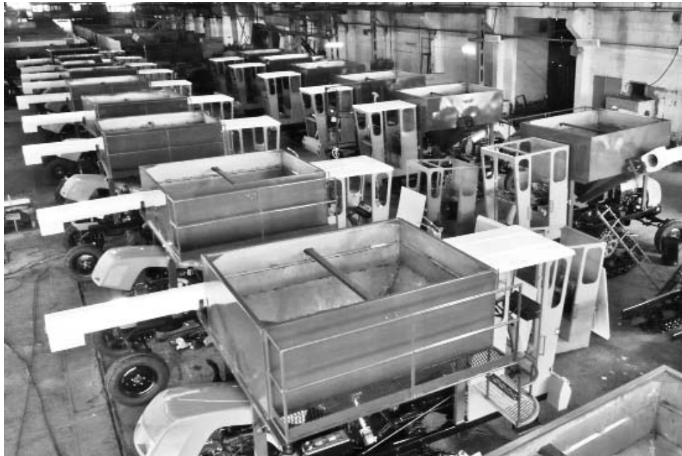
En la Tractolva - 2012 fueron eliminados problemas técnicos detectados durante el funcionamiento de la primera versión.

“Debimos fabricarlas este año, pero nos afectó el suministro tardío de los principales recursos. Para cumplir con