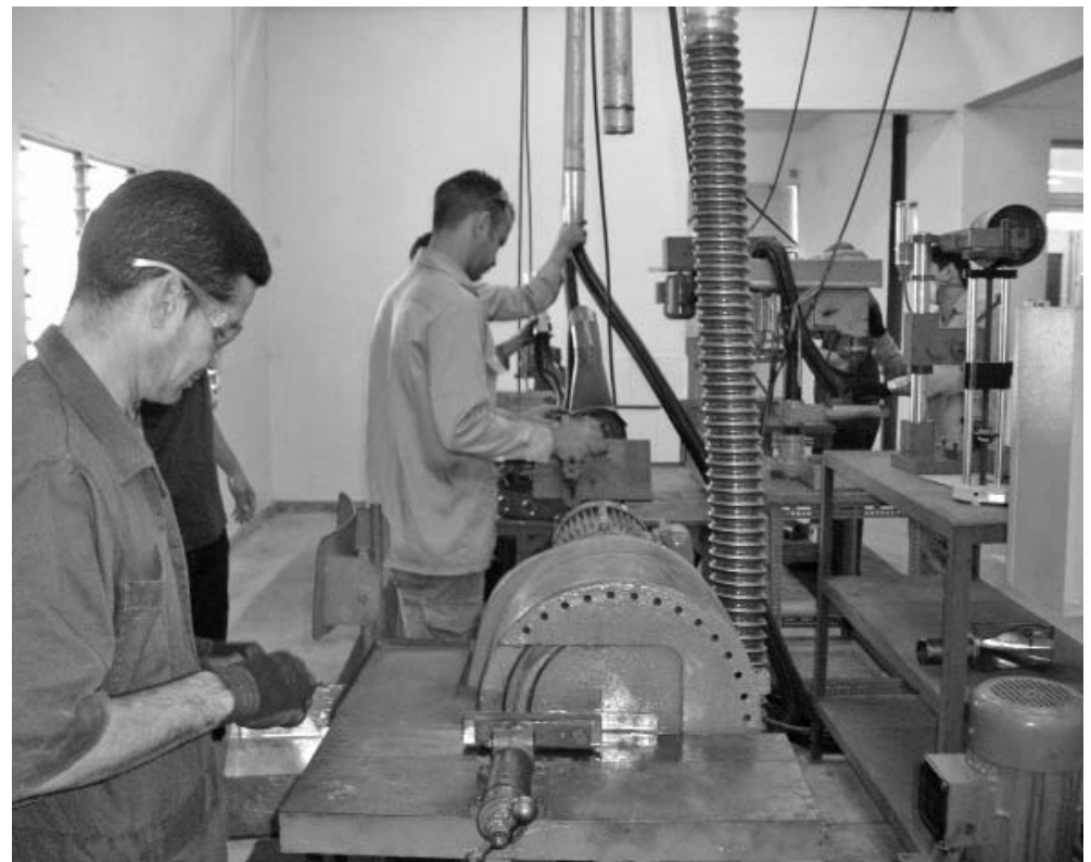
Es destacada la productividad de los operarios.

Dijo que desde el punto de vista económico el nuevo centro reporta ganancias por encima del 20 % de lo obtenido antes de su apertura. El T-15 alberga otras plantas de piezas de goma, enrollados eléctricos, reparación de calderas industriales y maquinado para los centrales, atendidas por 65 trabajadores vinculados directamente a la producción (la totalidad de la plantilla).