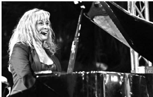
Bellita encarna los más altos valores de la mujer cubana en el jazz.