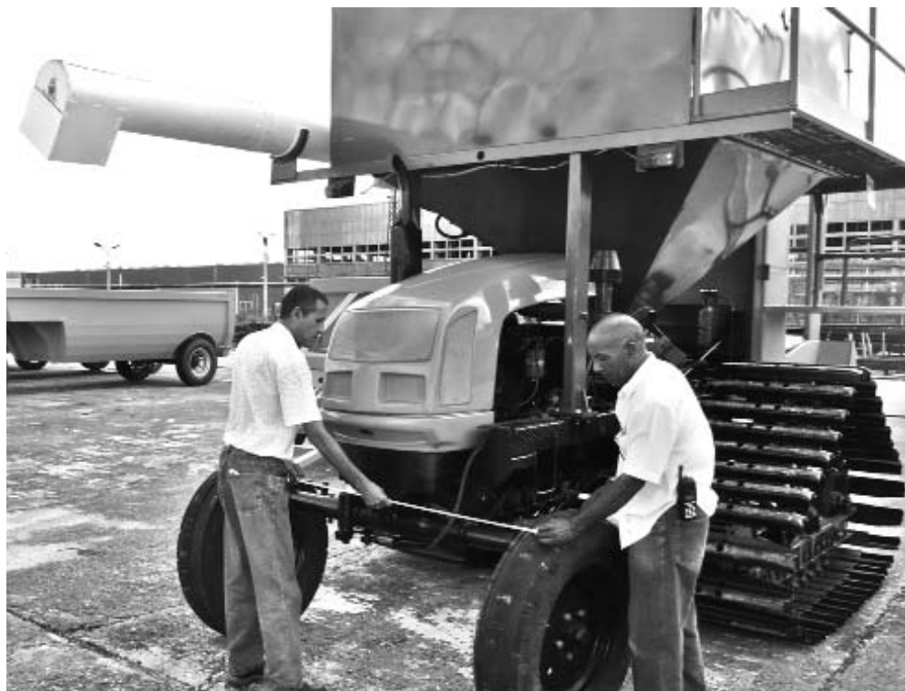
Estas máquinas son parte de la gran familia de implementos fabricados para sembrar y cosechar arroz. Obsérvese en segundo plano los remolques ensamblados este año.

la entrega, aplicaremos las experiencias de estos días, caracterizados por la organización del proceso productivo en interés del aprovechamiento de la jornada laboral y la calidad de las labores. En la línea de producción, en respuesta a las necesidades y de acuerdo con el método de Dirección Participativa, estamos los principales responsables de la UEB, cada uno en un frente específico, para controlar las actividades y ayudar a solucionar problemas”.