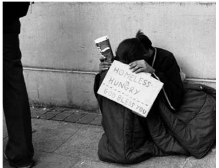
Más de 160 mil personas han sido expulsadas de sus hogares en Inglaterra y Gales entre el 2008 y el 2011.

El problema es que el ajuste afectará también a los presupuestos de las organizaciones benéficas y los que finalmente sean desalojados tendrán más problemas para encontrar alternativas. La institución religiosa Depaul es una especie de Bed and Breakfast (Cama y desayuno) para los sin techo de entre 15 y 25 años que da hogar a unos dos mil jóvenes: "Los anteriores ajustes nos han reducido ya un 35 % las ayudas y cada vez tenemos menos recursos". Como consecuencia de este recorte con doble efecto (sobre los desahuciados y las organizaciones que les ayudan), una de cada cinco personas que pierdan su casa