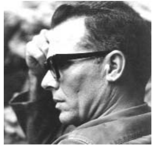
Faustino Pérez Hernández (Taguasco, 1920-Ciénaga de Zapata, 1992). Este 24 de diciembre se cumplen 20 años de su deceso.