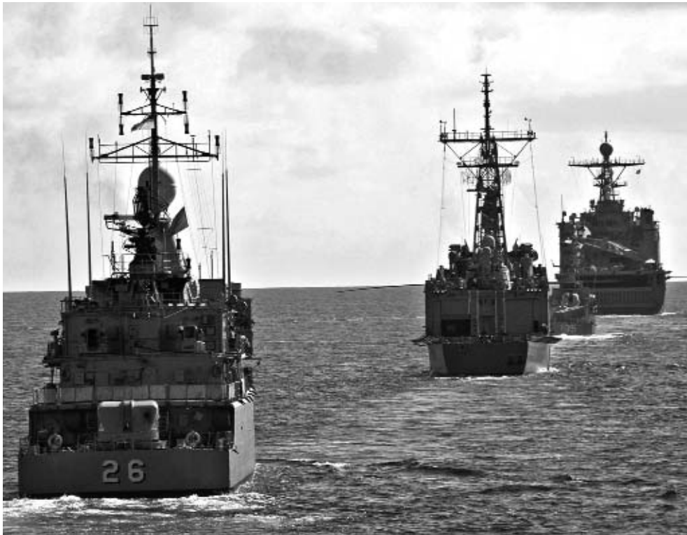
El Pentágono trasladaría antes del 2020 el 60 % de sus fuerzas navales hacia las aguas del Pacífico, una región de alta importancia geopolítica.

El país norteamericano dispone en la actualidad de más de 85 mil militares en Asia Pacífico. Solo en Japón concentra alrededor de 47 mil efectivos. Sin embargo,