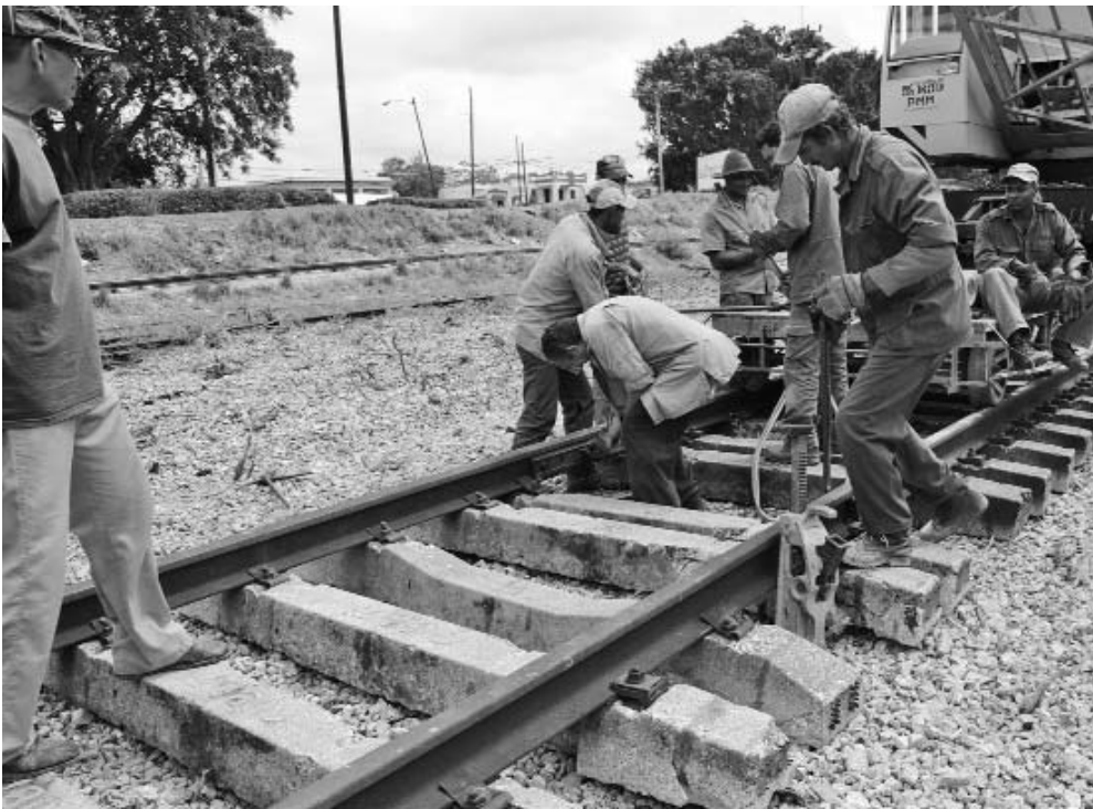
El esfuerzo diario que despliegan los trabajadores del sector para la recuperación del ferrocarril, se traduce en incalculables beneficios para la economía.