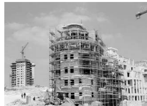
Asentamientos ilegales israelíes en Cisjordania.