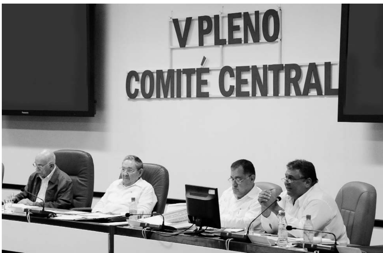
El miembro del Buró Político Marino Murillo Jorge, Jefe de la Comisión Permanente para la Implementación y Desarrollo, informó sobre las acciones desarrolladas para poner en marcha los Lineamientos, tema que también fue presentado en la más reciente reunión del Consejo de Ministros.

En esta reunión fueron analizadas la marcha