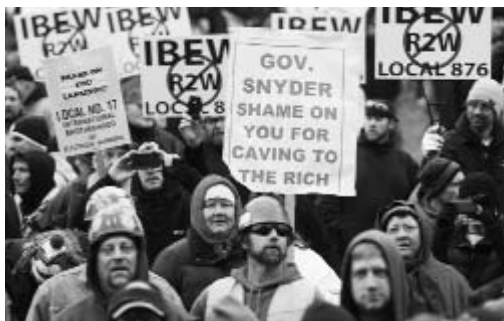
Cientos de personas se congregaron frente al capitolio, e hicieron sonar silbatos, al tiempo que coreaban consignas como “el pueblo está unido”.

“Habrá sangre. Tendrá consecuencias”, aseguró el representante Douglass Geiss, quien