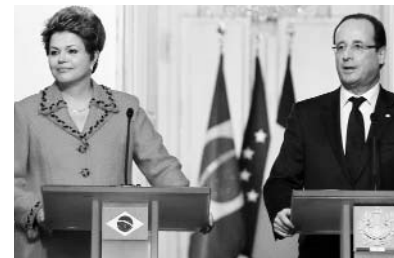
La mandataria brasileña, Dilma Rousseff junto a su homólogo francés, Francois Hollande.

Por su parte, el Dignatario galo, señaló que la crisis hizo surgir una nueva conciencia sobre la necesidad de estar más unidos y planteó como prioridades el crecimiento, la lucha contra el desempleo juvenil, la transición energética y el enfrentamiento a las desigualdades.