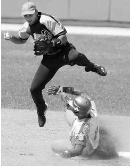
¿Volverán los cuatro grandes a la cima?