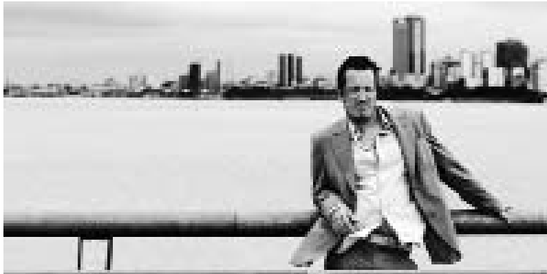
Pescador, filme ecuatoriano.