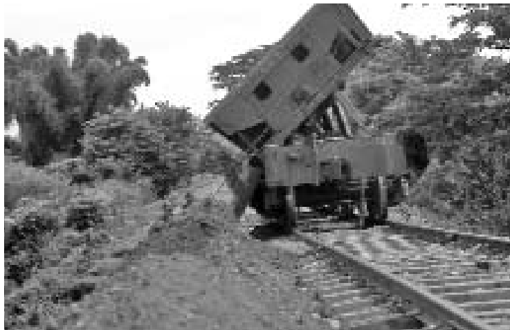
El empleo de material cercano a la zona dañada permitió abaratar los costos de la reparación del ramal.

Con esta fórmula fueron colocados en la vía miles de