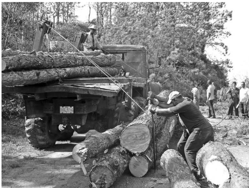
Ante las complejidades se impone la voluntad de los trabajadores forestales.

Por encima de cualquier insuficiencia en el equipamiento tecnológico, se impone la voluntad de los hombres, quienes sacan sobre sus hombros las varas rollizas y emplean cables de acero tirados por los tractores para arrastrar los bolos desde la profundidad del monte