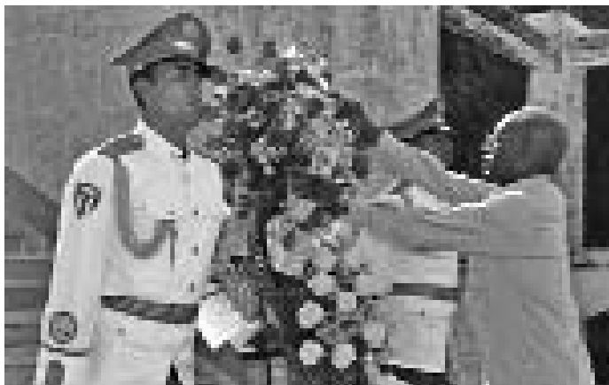
El Jefe del Estado Mayor General de las Fuerzas Armadas de Angola (FAA), Geraldo Sachipengo Nunda, deposita una ofrenda floral en el Panteón a los combatientes internacionalistas caídos por la independencia de otros pueblos.

El alto jefe militar angolano declaró que su visita —iniciada el 26 de noviembre último— tiene como objetivo fortalecer las relaciones entre los dos Estados y pueblos, y responde a una invitación formulada por el General de Cuerpo de Ejército Leopoldo Cintra Frías, ministro de las Fuerzas Armadas Revolucionarias de Cuba.