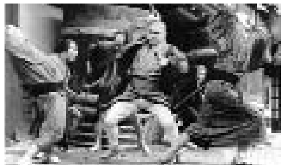
La peculiar esgrima de Ichi marcó una generación de cinéfilos cubanos.