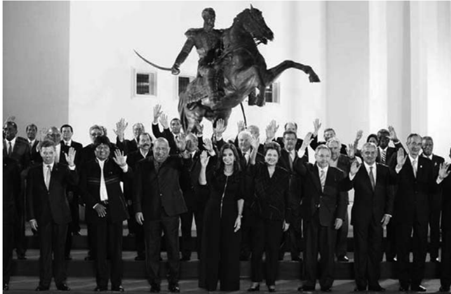
Jefes de Estado y de Gobierno latinoamericanos y caribeños durante la Cumbre fundacional de la CELAC en Caracas, Venezuela, en el 2011.

La delegación de paz de las FARC-EP solicitó formalmente este domingo a directivos del Comité Internacional de la Cruz Roja (CICR)