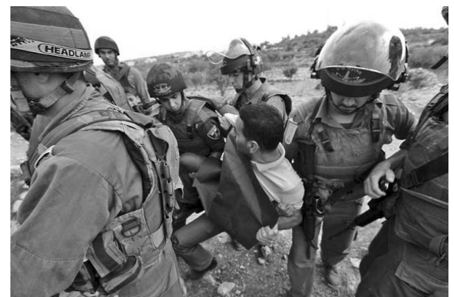
Joven palestino es reprimido por protestar contra la construcción de nuevos asentamientos israelíes en territorio ocupado, tras la decisión de la ONU.

¿Olvidan Washington y Tel Aviv que en el año 1947, precisamente un 29 de noviembre, la Resolución 181 de la ONU decidía la constitución de dos estados, uno judío, que