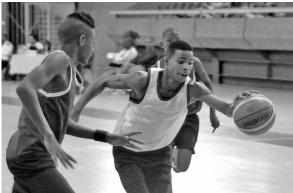
Los "cubanitos" exhibieron los mejores biotipos del torneo.

Analizando algunos detalles de lo apreciado en el Encuentro Latinoamericano, saltan a la vista la notable talla de nuestros jugadores en las edades de 14 y 15 años, quienes, junto a los de 16, demostraron un poco más de dominio de los fundamentos del básquet, aunque desde la línea de tiros libres la efectividad estuvo pésima, como ocurre