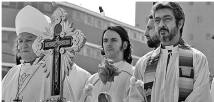
Ricardo Darín (a la derecha) como un sacerdote en Elefante blanco , de Pablo Trapero.