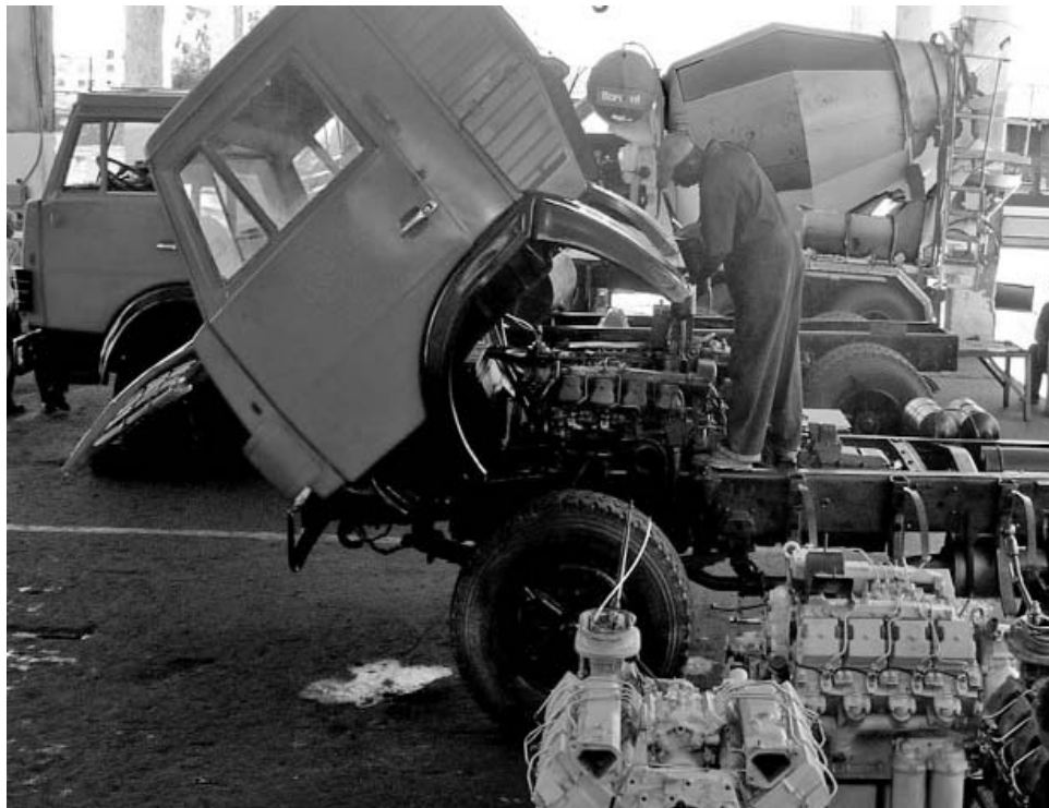
Con la recuperación de las hormigoneras se continúa aprovechando el parque de equipos existente en el país.