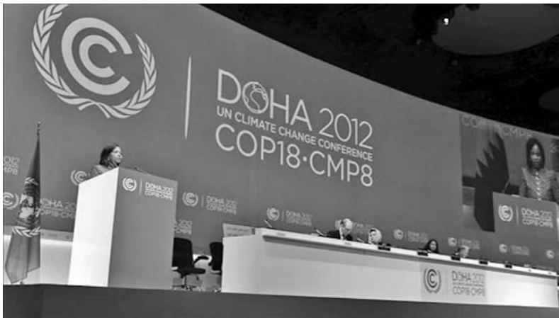
Ceremonia de apertura de la Cumbre de Naciones Unidas sobre Cambio Climático.

Un grupo de expertos de una de las agencias de Inteligencia de Reino Unido no ha logrado descifrar un mensaje atado a la pata de una paloma muerta en la II Guerra Mundial. El papel escondido dentro de un tubo metálico contiene 27 grupos de cinco letras desconocidos por los analistas, que durante varias semanas intentaron identificarlos. Se estima que unas 250 mil palomas fueron utilizadas por los militares como un importante medio de comunicación. (BBC Mundo)