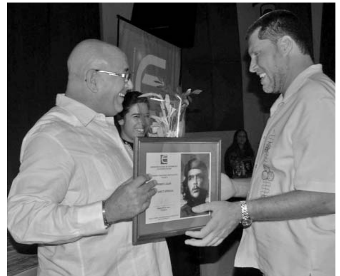
La provincia espirotuana, ganadora de la emulación nacional, recibe el reconocimiento de la ANEC.

El dirigente evocó el ejemplo del Che Guevara, su papel en aquellos años difíciles de la Revolución donde de manera simultánea se desataban los nudos del viejo régimen y se empoderaba a los trabajadores, y recordó cómo en tales circunstancias él nunca dejó de aprender ni de enseñar, una lección con plena vigencia para los economistas de hoy. “Cuando se quiebran economías aparentemente modélicas y se avecinan