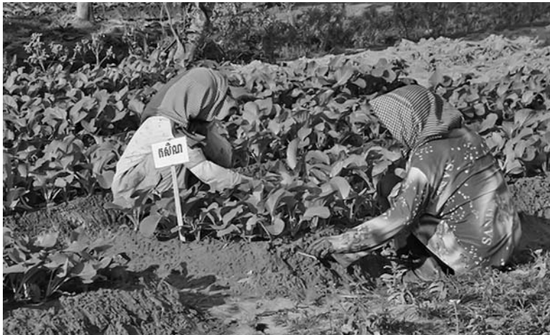
La agricultura es la principal actividad económica en Laos.

Sin embargo, algunas naciones desarrolladas como Estados Uni-