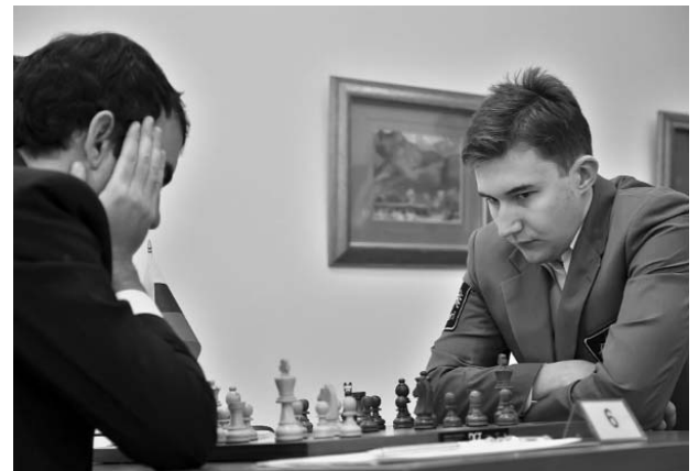
El cubano en su encuentro de ayer con Karjakin.