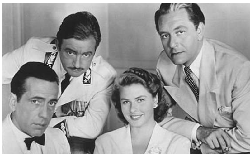
De izquierda a derecha, Humphrey Bogart, Claude Rains, Ingrid Bergman y Paul Henreid.

A 70 años del clásico, se busca entonces a un nuevo Michael Curtiz que, sin perder en sensibilidad, sea capaz de moverse entre fantasmas.