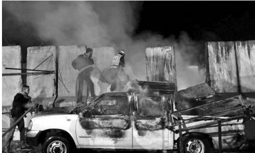
La marina de guerra de Israel lanzó un cohete contra la vivienda del líder de Hamas en Gaza.

La ausencia de un proceso de ese tipo —señaló— es también motivo del fracaso en otros proyectos. En tal sentido, expresó, se impone inyectar un mayor nivel de planificación científica en todo el “frente de batalla”. (PL)