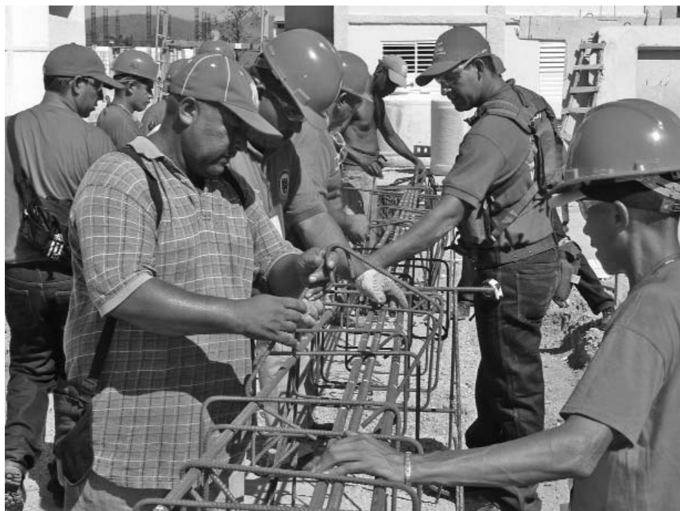
Apenas una breve explicación y todos muestran dominio en el amarre de aceros.