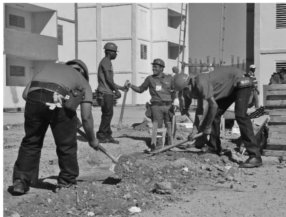
Bajo el fuerte sol la brigada se enfrenta a cualquier tarea constructiva.