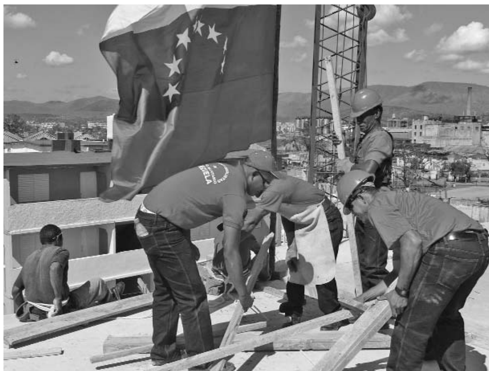
Jóvenes y experimentados constructores conforman la brigada venezolana.