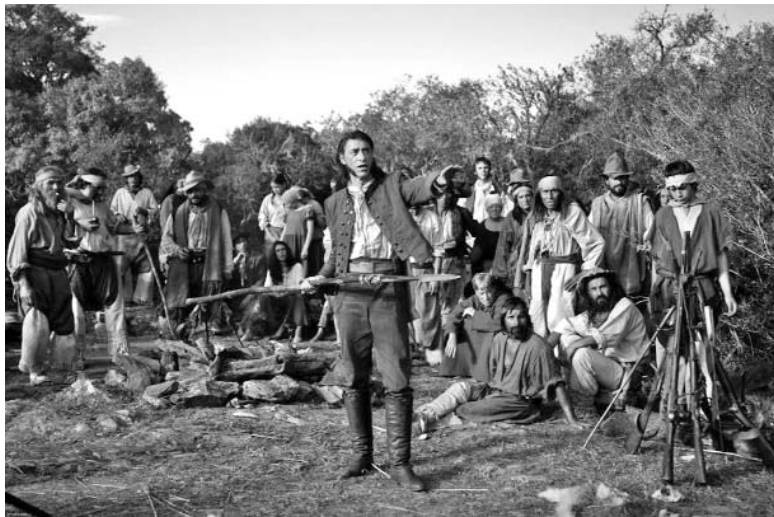
Artigas: La Redota , del uruguayo César Charlone, se exhibirá en el homenaje al Bicentenario de la Independencia de los pueblos latinoamericanos.

Al concurso de largometrajes de ficción concurrirán películas que han recorrido con éxito algunos de los festivales convocados en diversos países a lo largo del año. Entre esas obras resaltan Violeta se fue a los cielos , del chileno Andrés Wood; No , de su compatriota Pablo Larraín; Fiebre de ratón , del brasileño Claudio Assis; Días de pesca , del argentino Carlos Sorín; Elefante blanco , de su coterráneo Pablo Trapero; Tres , del uruguayo Pablo Stoll; y Post tenebras lux , del mexicano Carlos Reygadas.