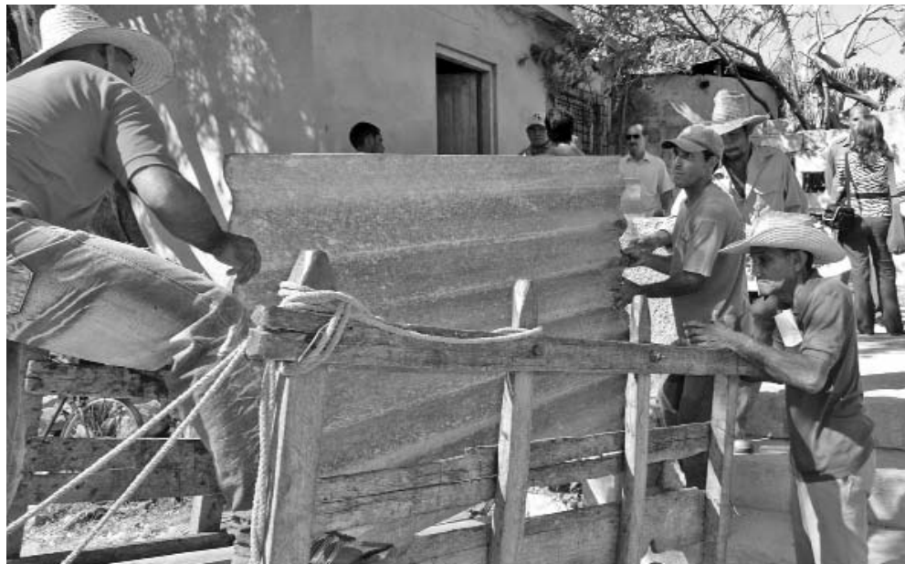
Decenas de personas fueron atendidas en el Punto de Venta de Barajagua desde el primer día de aplicación del beneficio concedido a los damnificados.

Fuente: Investigación Martí en La Habana, de la Sociedad Cultural José Martí.