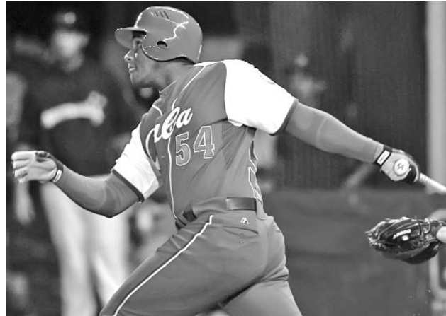
Alfredo Despaigne despertó y fue el puntal ofensivo en los dos últimos partidos en Taipei de China.