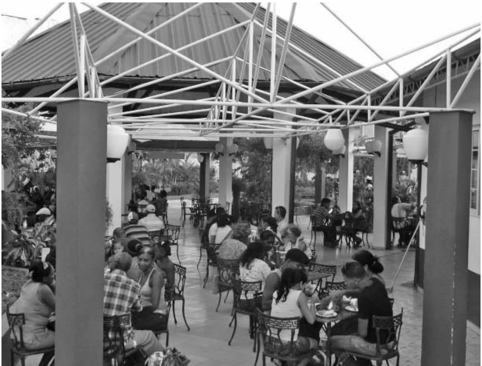
Aunque faltan algunos toldos predomina el buen servicio a la población.