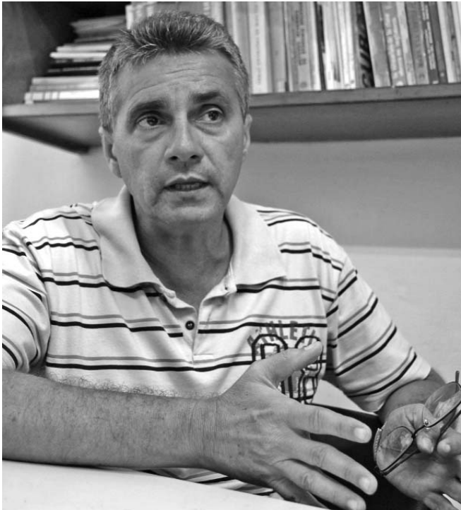
Según Varona Domínguez, la colección recoge la idea magnífica de incluir un ensayo introductorio en cada tomo para orientar al lector en su consulta.