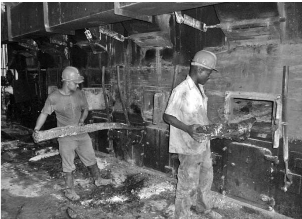
En el área de generación de vapor se produjo el mayor tiempo perdido en la zafra precedente.

“En el central constituimos un grupo técnico encargado de certificar la calidad de