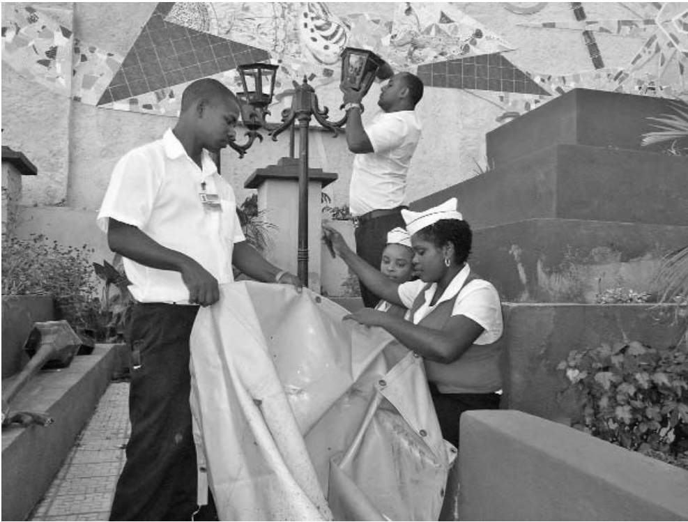
De inmediato el colectivo emprendió la recuperación de los toldos y lámparas coloniales.