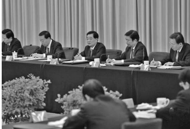
El mandatario insistió en que el país debe redoblar esfuerzos por aumentar el bienestar del pueblo chino.

En su intervención, Ban Ki-moon insistió en la necesidad de reducir las emisiones de gases de efecto invernadero y de fortalecer la adaptación para enfrentar golpes aún mayores del clima, "los cuales ocurrirán sin importar lo que hagamos".