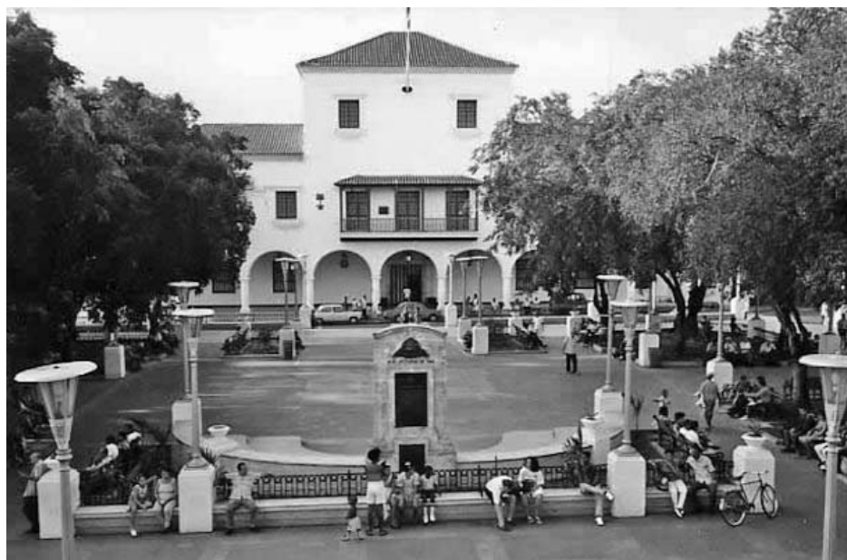
La arboleda del parque Céspedes quedó totalmente destruida.