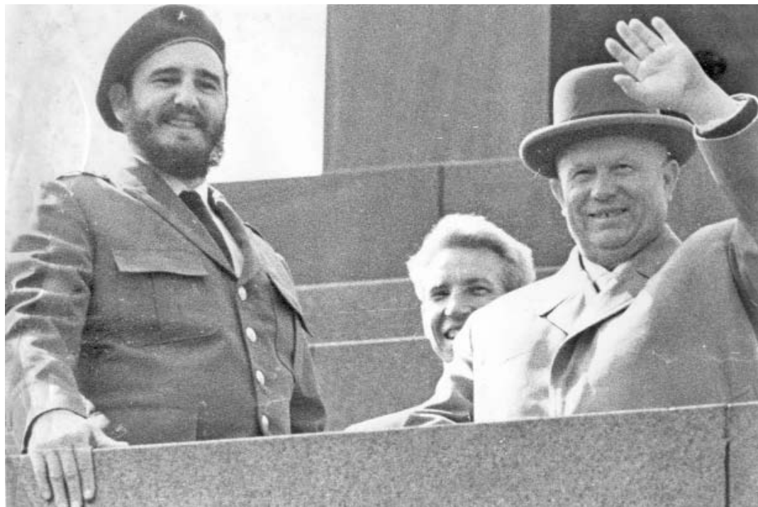
Fidel y Jruschov saludan desde la tribuna del Kremlin en la Plaza Roja de Moscú el desfile del 1ro. de mayo de 1963.

ÓRGANO OFICIAL DEL COMITÉ CENTRAL DEL PARTIDO COMUNISTA DE CUBA