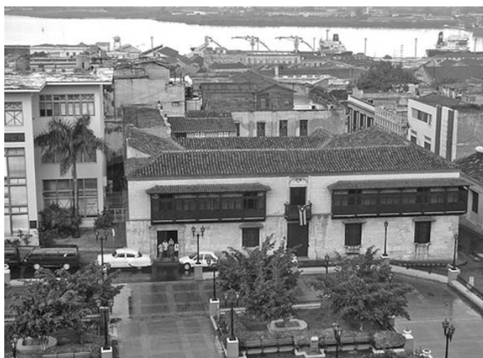
Una vista de la casa antes del huracán. Salvo los árboles, el resto de la casa quedó indemne.