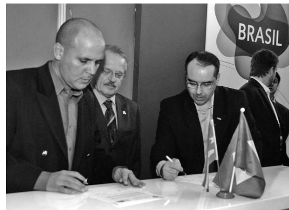
La firma de múltiples convenios entre Cuba y Brasil confirma las excelentes relaciones comerciales entre ambos países.

Para inicios del 2013, dijo, Brasil prevé la importación del medicamento Heberprot-P, lo que contribuirá al desarrollo