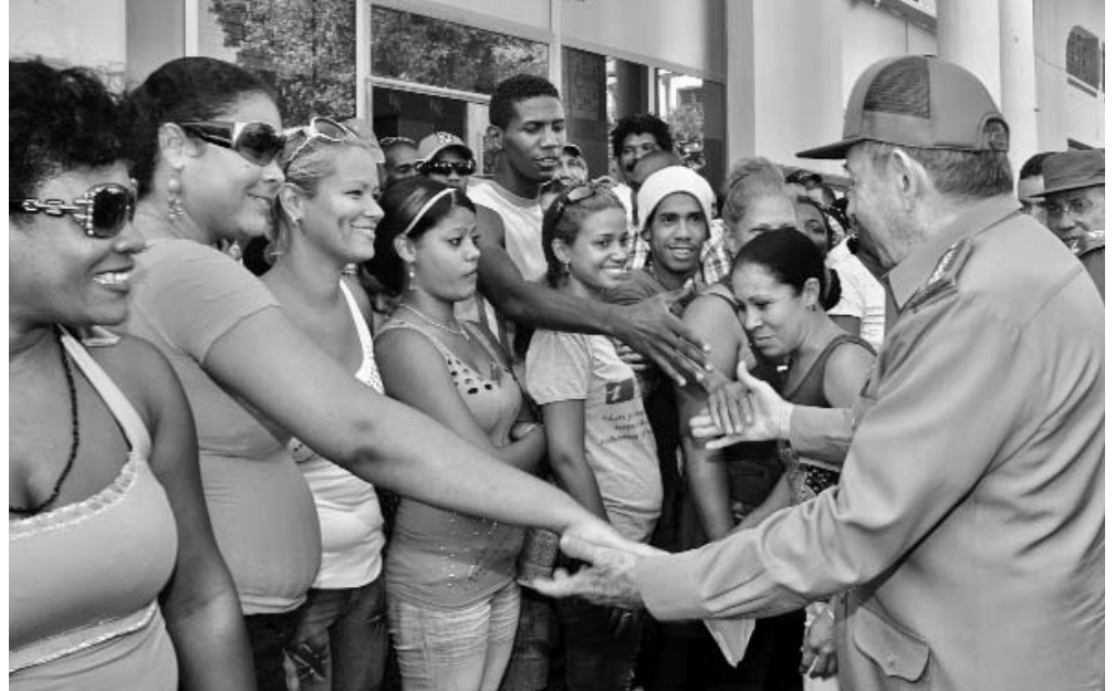
Emocionante fue el contacto con los guantanameros en pleno parque central de la capital provincial.