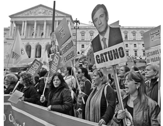
Una manifestante sostiene una pancarta con la foto del primer ministro, Pedro Passos Coelho, junto a la palabra ladrón.

Asimismo, durante la protesta se escucharon reiterados gritos de “Basta la troika”, en referencia a los prestamistas de la Comisión Europea, el Fondo Monetario Internacional y el Banco Central Europeo, que han impuesto durísimas condiciones