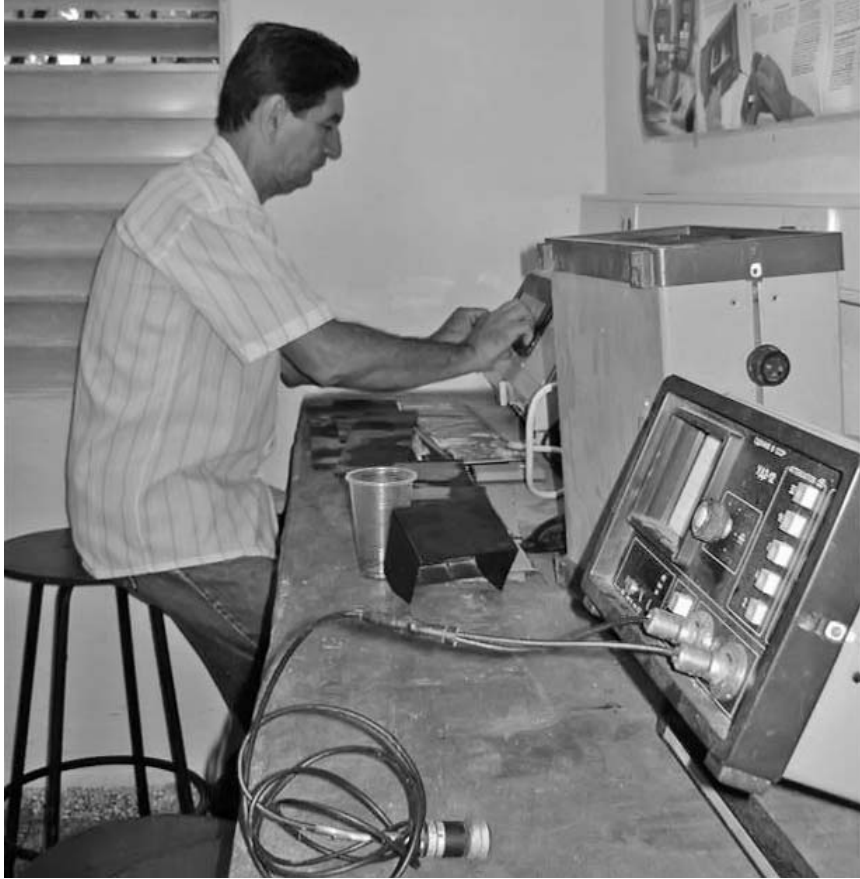
El laboratorio del Centro de Investigaciones de Soldadura resulta decisivo en las investigaciones.