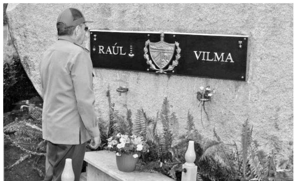
Homenaje a Vilma en el Mausoleo del Segundo Frente.