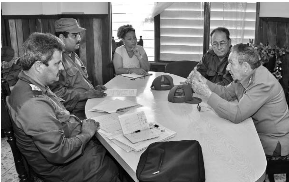
El Presidente del Consejo de Defensa Municipal de La Maya, informó sobre los daños sufridos por el territorio.