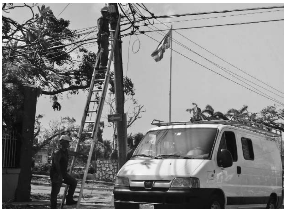
Como los trabajadores de la telefonía de Habana del Este, cientos de brigadas de distintos sectores del país brindan su ayuda solidaria a Santiago de Cuba.