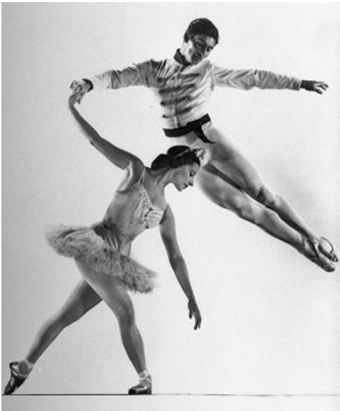
Alicia y Youskevitch en los días del American Ballet Theater.

Youskevitch apoyó el sueño de Alicia y Fernando de fundar una compañía cubana, por lo que se