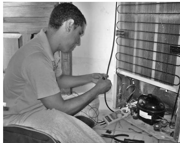
Cerca de 50 técnicos de la Empresa Provincial de Servicios Técnicos, Personales y del Hogar, se empeñaban en devolver la vida útil a los equipos afectados.