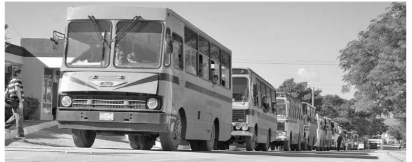
La mayor cantidad de evacuados se encontraba en centros estudiantiles de la cabecera provincial.