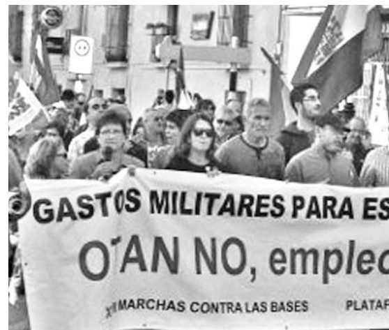
Los manifestantes marcharon con una pancarta con el lema "Gastos militares para escuelas y hospitales" y "OTAN no, empleo y vivienda sí".

Solo en el mes de septiembre perdieron sus puestos en Francia casi 47 mil personas, un promedio de más de 1 500 cada día, y las cifras, según el titular de Trabajo, Michel Sapin, podrían agravarse durante los próximos meses.