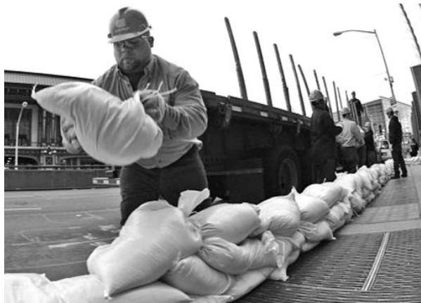
Los residentes colocan sacos de arena en las zonas bajas.

El presidente estadounidense, Barack Obama, pidió a la ciudadanía del noreste del país prepararse para una "seria y gran tormenta". El mandatario suspendió los viajes que tenía previstos dentro de la campaña electoral y regresó a Washington para encabezarla