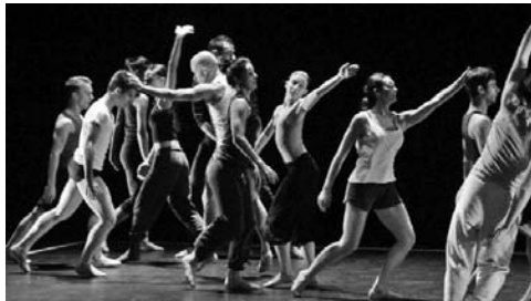
El Malandain Ballet Biarritz, entre las compañías invitadas al Festival.

Entre las compañías extranjeras figuran la