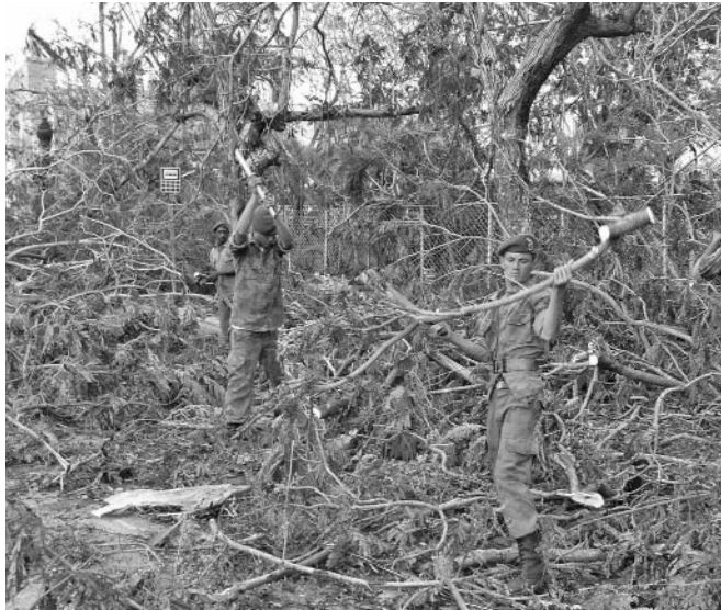
Algunas zonas urbanas quedaron cubiertas de malezas.

Atención especial ha recibido la producción y venta de alimentos, mediante la recuperación de la industria del sector y la creación de diversos puntos para la venta a precio diferenciado de granos, productos de la avicultura, pulpas y mermeladas de frutas, y viandas, así como