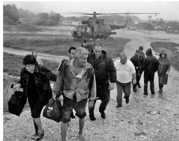
Fue necesario utilizar helicópteros para proteger la vida de personas que quedaron aisladas.