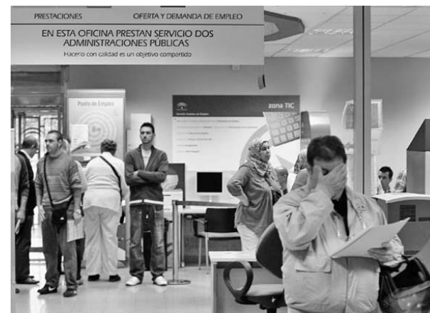
El desempleo en España hoy es el más alto desde 1976, cuando comenzó a llevarse la serie estadística.

Advirtió a los presentes tener mucho cuidado con los golpistas, que ahora aparecen maquillados como demócratas en la prensa, a pesar de haber puesto fin a los programas sociales creados durante su Gobierno para ayudar a los más necesitados.