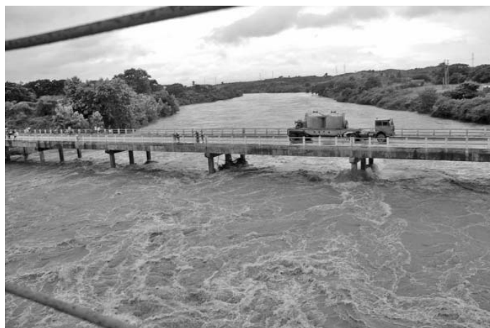
La crecida del Zaza obligó a cerrar la Carretera Central desde la mañana de este viernes.