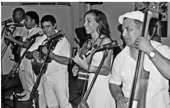
Los Guanches en La Claqueta.

Prueba al canto, la demostración de Los Guanches, una de las agrupaciones más