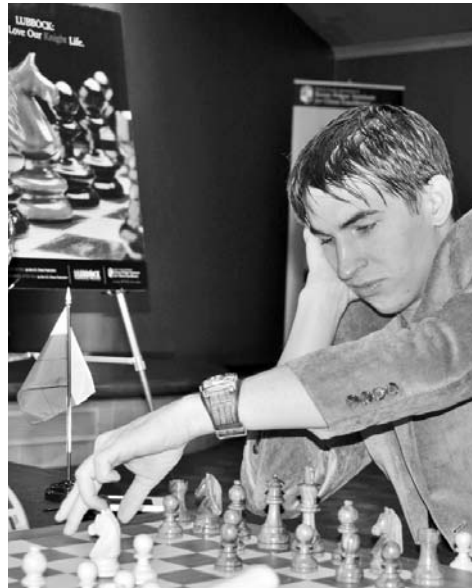
El ruso Dmitry Andreikin sorprendió con su victoria a costa del estadounidense Hikaru Nakamura, quinto del escalafón mundial.

El trebejista tunero buscará reeditar el galardón y obtener una de las cuatro plazas en disputa para la venidera Copa del Mundo, y para ello deberá sortear con cautela las 11 rondas de una lid que él mismo calificó como de "alto nivel competitivo y mucha tensión" en entrevista al sitio oficial del certamen.