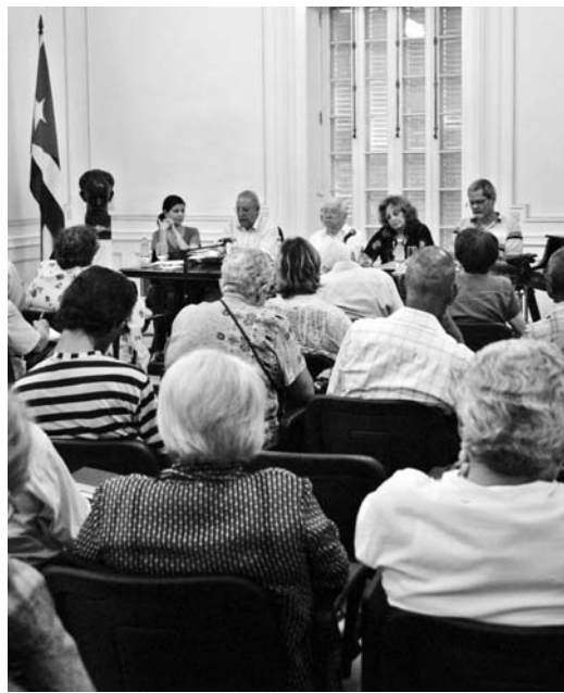
El debate propició un diálogo de generaciones.