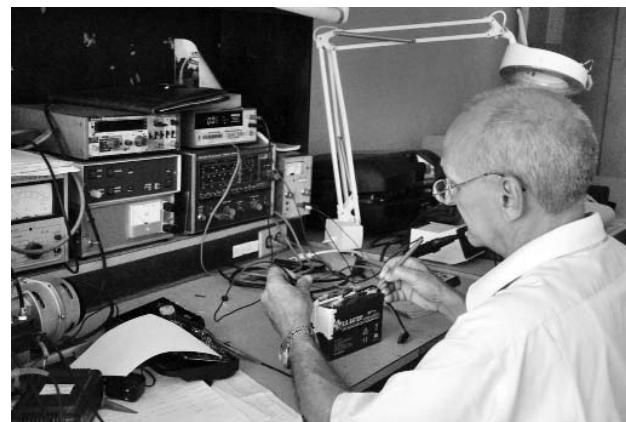
La recuperación de muebles y equipos evita costosas importaciones.

Entre el equipamiento rehabilitado sobresalen las unidades dentales, aspiradoras, autoclaves de mesa, compresores, máquinas de anestesia, equipos auditivos, monitores y electroestimuladores.