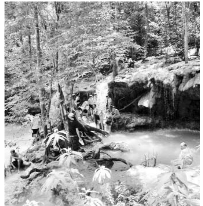
La abundante sombra y la limpieza de su entorno, dos de los atributos de Rancho Querete.