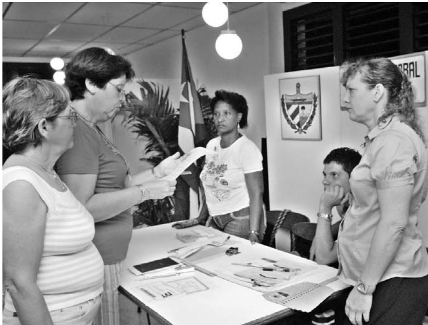
En los colegios se comprobará que estén garantizadas todas las condiciones.

ÓRGANO OFICIAL DEL COMITÉ CENTRAL DEL PARTIDO COMUNISTA DE CUBA