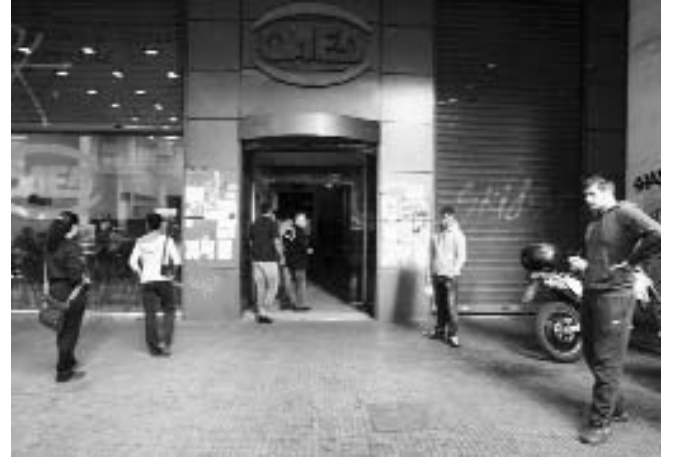
Jóvenes esperan afuera de la Oficina de Empleos en Atenas.

Pero según numerosos analistas, como el premio Nobel de Economía Paul Krugman, esos ajustes no hacen más que agravar la recesión.