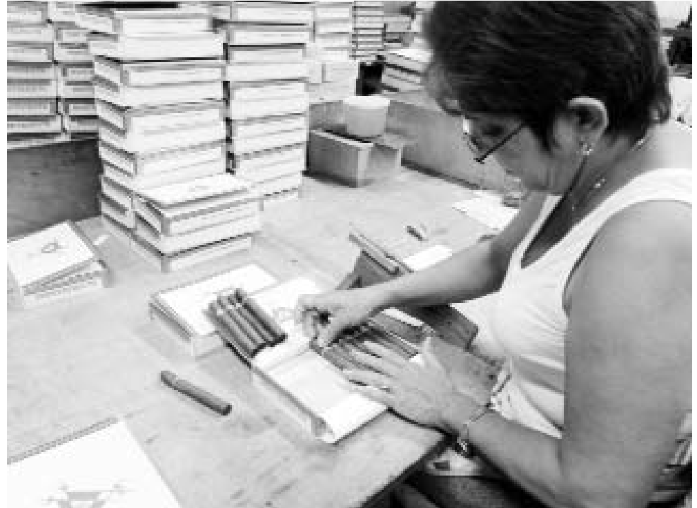
Más de 800 obreros laboran en las unidades de la entidad.

A criterio de la directora económica, el destrabe “pasaría por dos soluciones: a) que al GELMA le aprueben el crédito solicitado para pagar a Tabacuba. De esa forma, el dinero entraría al fin al Grupo; b) una prórroga de los créditos vencidos de las empresas de Tabacuba, o que el banco nos conceda créditos para saldar cuentas por cobrar y pagar a las empresas del Grupo. A todas luces, esto no constituiría lo idóneo porque conlleva un interés bancario y va en