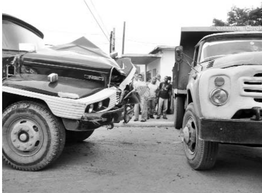
Reducir los accidentes es una de las prioridades del Plan Nacional de Seguridad Vial.