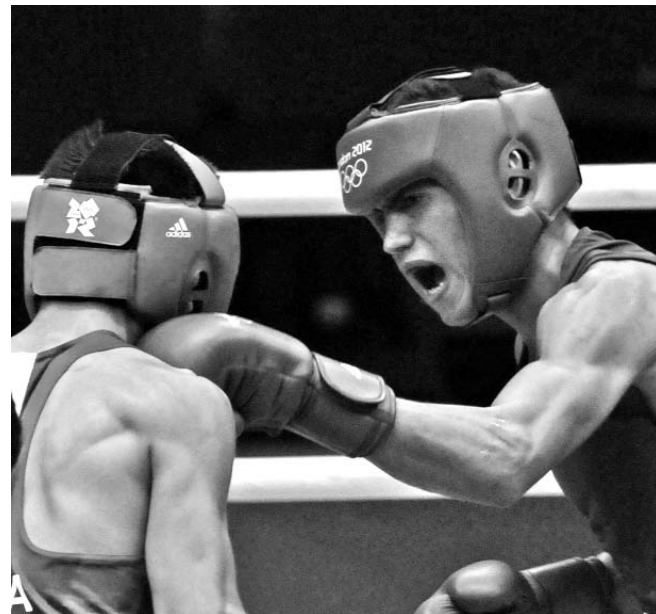
El monarca olímpico Robeisy Ramírez, una de las atracciones para el próximo Playa Girón.