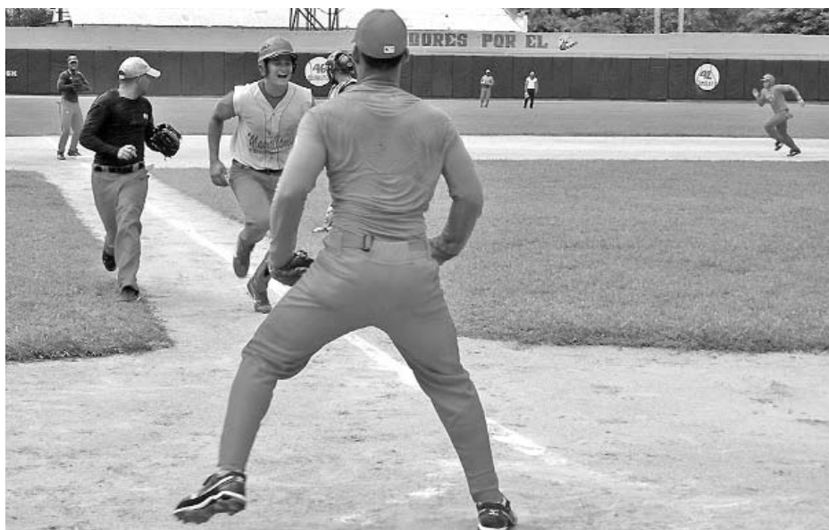
El entrenamiento le concede importancia al estilo de juego rápido.