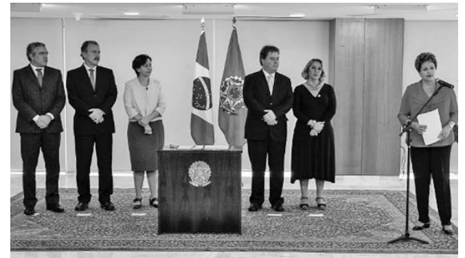
Brasil Cariñoso beneficiará a unos cinco millones de infantes.

Bolsa Familia es considerado el más abarcador del mundo con 11 millones de núcleos beneficiados y provee una red de seguridad a un cuarto de la población de Brasil, al ofrecer apoyo económico como parte de la protección social a un costo equivalente al 0,4 % del PIB del país. (PL)