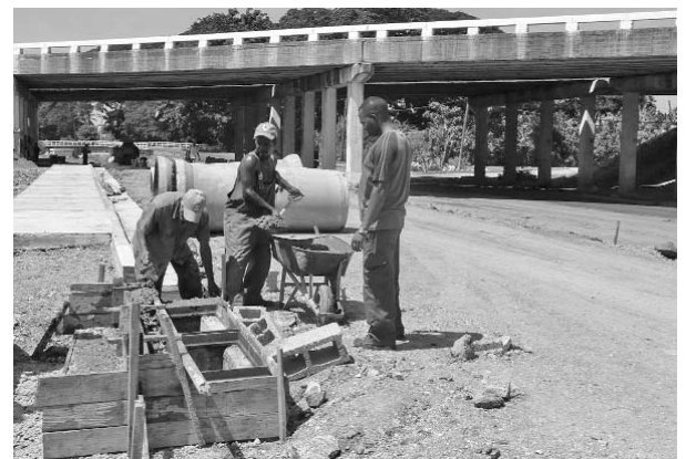
La ejecución entre el puente del Río San Juan y Docureaux.

A diferencia de los seis metros con que cuenta hoy, la carretera tendrá un ancho desde 13 metros hasta diez (en la parte más estrecha), contará con un separador central y se enlazará en el kilómetro-2 con la circunvalación de la ciudad, tanto en sen-