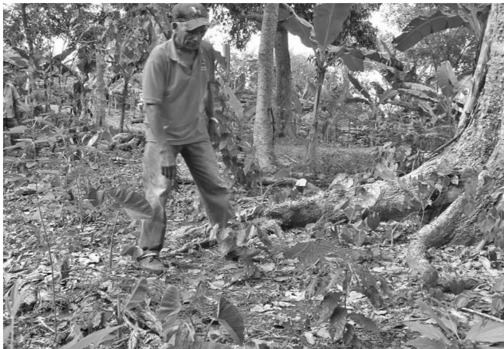
Con apenas dos años y pese a la sequía, los cafetos de la UBPC La Juba muestran ya el impacto de la transformación acometida.

Estratégicamente integran a su principal renglón económico el cultivo de viandas, frutales y árboles maderables