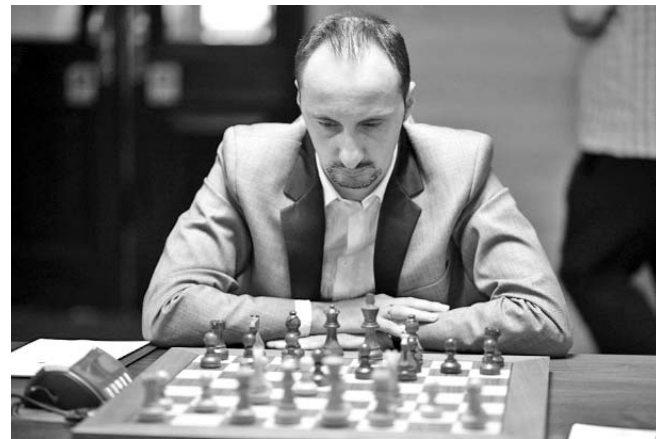
Topalov se ratificó como uno de los trebejistas más sólidos en la elite universal.

El anuncio, publicado en el sitio web de la Federación Internacional de Ajedrez, también da como inscritos a los