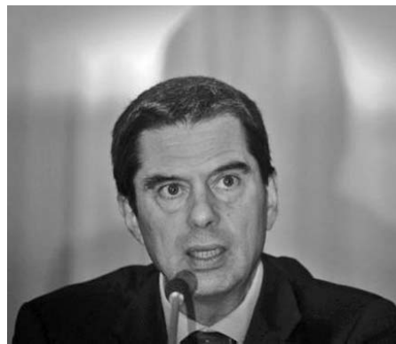
Vitor Gaspar, ministro de Finanzas portugués.

Las nuevas medidas forman parte del presupuesto para el 2013 que será presentado el 15 de octubre ante el Parlamento e incluirán aumentos de impuestos sobre los ingresos del sector privado pero también sobre los ingresos del capital y del patrimonio.