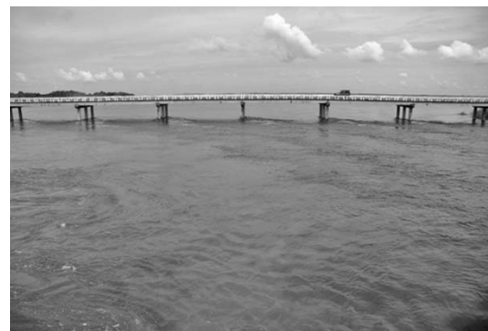
A las 4:00 p.m. de ayer la Zaza rondaba los 920 millones de metros cúbicos.

hogares los más de 5 800 habitantes que residen en comunidades ubicadas aguas abajo de la presa —Tunas de Zaza, El Médano, Vallejo y Tayabacoa, entre otras—, quienes, ante posibles inundaciones, habían sido trasladados a zonas seguras, fundamentalmente de la capital provincial, en la noche del martes.