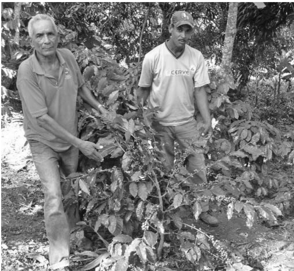
El programa integral de recuperación cafetalera constituye una prioridad para los productores del Segundo Frente.