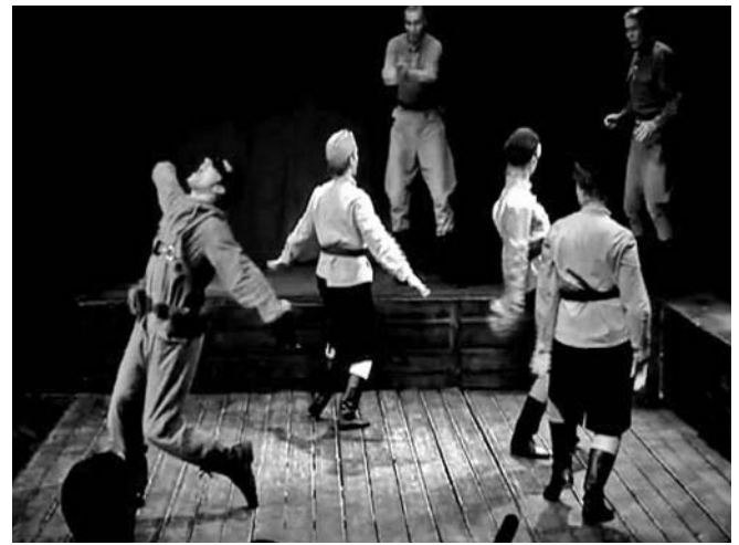
Escena de Esperanza, fe y amor , por el colectivo ruso Et Cétera.

Desde Los Ángeles, sede del Oscar, los directivos del afamado premio no han abierto aún la boca, pero es de esperar que lo hagan, y pronto, a partir de una preocupación que ya empieza a tomar cuerpo: ¿Y qué pasaría con el universo económico-cinematográfico de Hollywood si mañana los ofendidos musulmanes decidieran cerrarle las puertas?