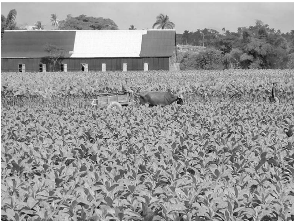
La variedad Corajo 2006, luego de cuatro años de prueba, abarcará en la próxima cosecha más de 13 mil hectáreas.

“Obtener una variedad nueva (Vivaldo es autor de seis), mediante cruzamientos, demora alrededor de diez años, y después hay que probarla en el campo para comprobar sus bondades, porque