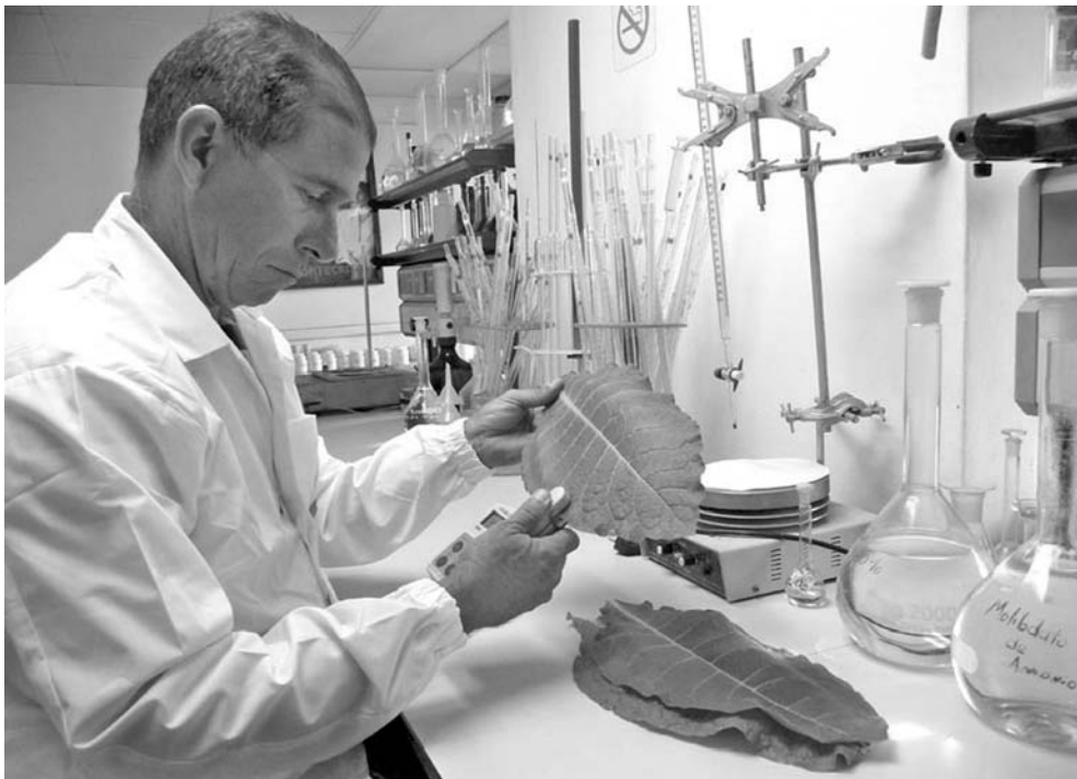
En la estación pinareña se han obtenido más de diez variedades resistentes a plagas y enfermedades.

De esa manera, se allanaría el camino para la introducción de otros aportes realizados por la estación como: la cura