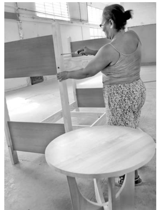
Calidad y excelente terminación es el compromiso mayor de la fábrica de Batabanó.

El reto de los trabajadores, técnicos y directivos es garantizar confort y seguridad con productos de la industria del mueble y otras especialidades en madera, mediante un proceso de mejora continua en el Sistema de Gestión Empresarial.