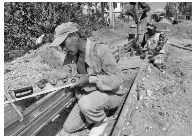
Construcción de aceras en la avenida Capitán Urbino.

De igual modo, se dio por concluida la reparación de la escalinata de más de 400 peldaños del parque de la Loma de la Cruz y se acomete la restauración de la plaza circular de la cima.