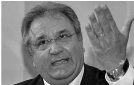
El titular del béisbol internacional propugna la unión con el softbol.

Opiniones de Riccardo Fraccari al término de la eliminatoria beisbolera para el Clásico Mundial, efectuada en Alemania