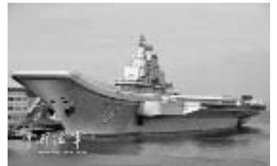
El portaviones Liaoning-16 fue entregado al EPL en la base naval de Dalian.

Un artículo publicado en el China Daily y reproducido por el Diario del Pueblo destaca el compromiso de Beijing de solucionar los conflictos regionales “a través de canales diplomáticos y negociaciones”, así como su oposición al “uso o amenazas de fuerza” como principio de su política exterior; rechazando de esta forma temores