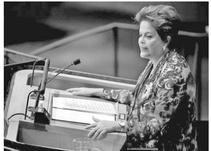
La presidenta Dilma Rousseff inauguró la 67 sesión de la Asamblea General de la ONU.

Este martes, la presidenta Dilma Rousseff pronunció el discurso en la inauguración de la 67 sesión de la