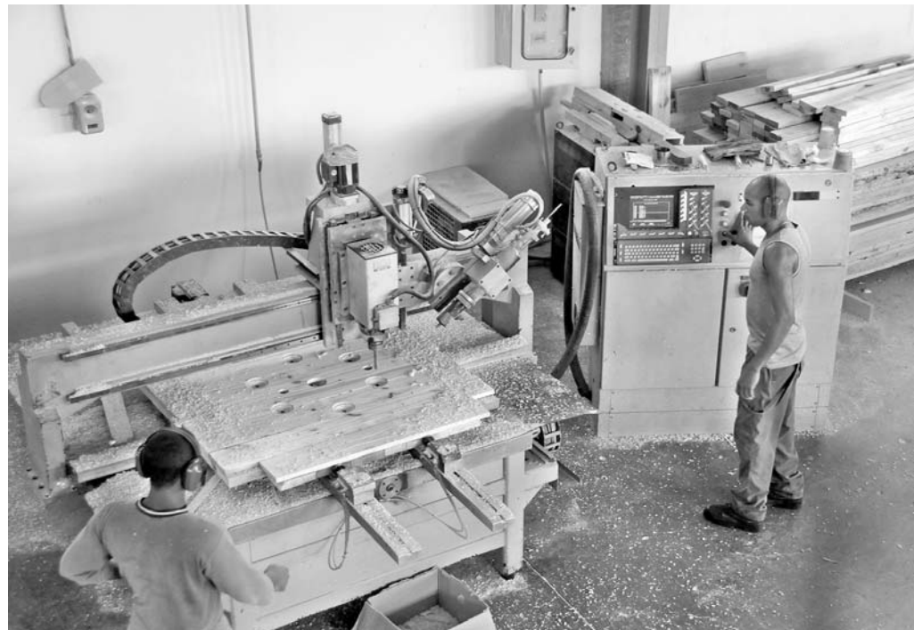
Estos elementos se producen para la fábrica de cables de San José.

"Otros, quizás, hubieran deseado irse bien lejos de este lugar. El día que salga de aquí creo que me muero, es el mejor lugar del mundo, la gente me admira y quiere; aquí es como si respirara mejor".