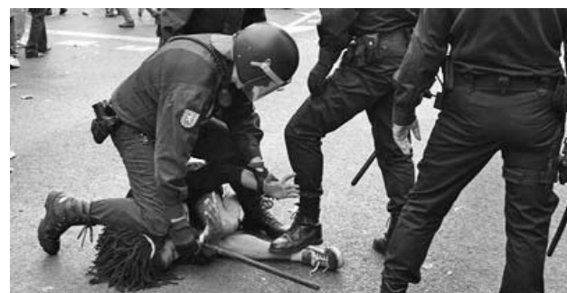
La policía arremetió contra los manifestantes y causó varias decenas de heridos.

La violencia comenzó en horas de la tarde, cuando un grupo de manifestantes intentó sortear las primeras barreras de seguridad que protegían el órgano legislativo. Las arremetidas policíacas continuaron por varias horas.