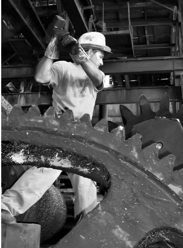
Reparaciones y preparativos tienen escenario concreto en el coloso tunero Antonio Guiteras.