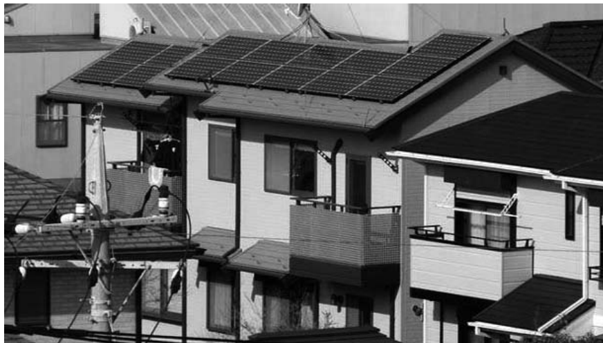
Los paneles solares son algunas de las fuentes de energía renovables que sustituirán las centrales nucleares en Japón.