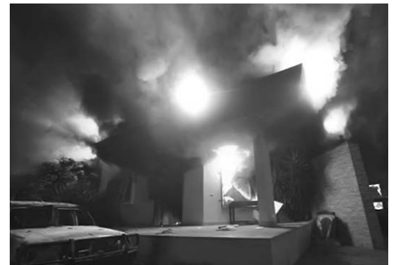
La película suscitó ataques contra las misiones diplomáticas estadounidenses en Libia y Egipto.

BENGHAZI, Libia, 12 de septiembre.—El embajador de Estados Unidos en Libia, Christopher Stevens, murió en un ataque contra el consulado en Benghazi, llevado a cabo por hombres armados que protestaban contra una película ofensiva para el Islam.