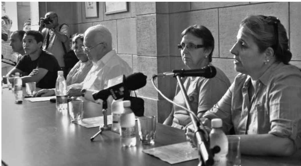
El intercambio de la FEU y los familiares de los Cinco recordó los 14 años de lucha contra el injusto encarcelamiento de los Héroes cubanos.