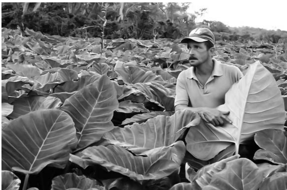
Los productores de Maisí aportan alrededor del 40 % de la cosecha de malanga de la provincia.

Actualmente, se experimenta el fomento de esta vianda en áreas llanas bajo riego de la Empresa Cultivos Varios Niceto Pérez, en el municipio de igual nombre, revela Cuadra con satisfacción.