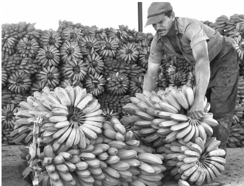
Guantánamo mantiene su tradición de provincia alta productora de plátano.

En Guantánamo este renglón se cultiva principalmente en áreas montañosas de los municipios de Maisí (aporta alrededor del 40 % de la producción), El Salvador, Baracoa, Manuel Tames, San Antonio del Sur, Imías y Yateras. La totalidad de las siembras es del género Xanthosoma .