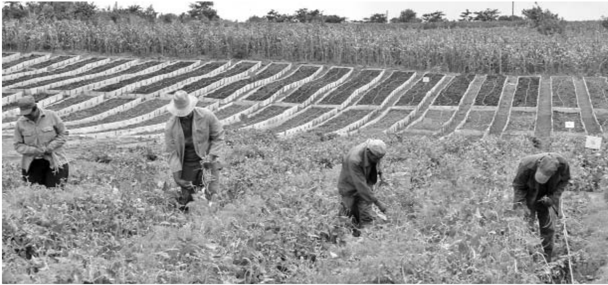
Las 17 acciones diseñadas para eliminar las ataduras impuestas a las UBPC, insisten en el reconocimiento de estas como personas jurídicas en igualdad de condiciones que el resto de las formas productivas.

sean priorizadas aquellas UBPC que mejor respondan productiva y financieramente.