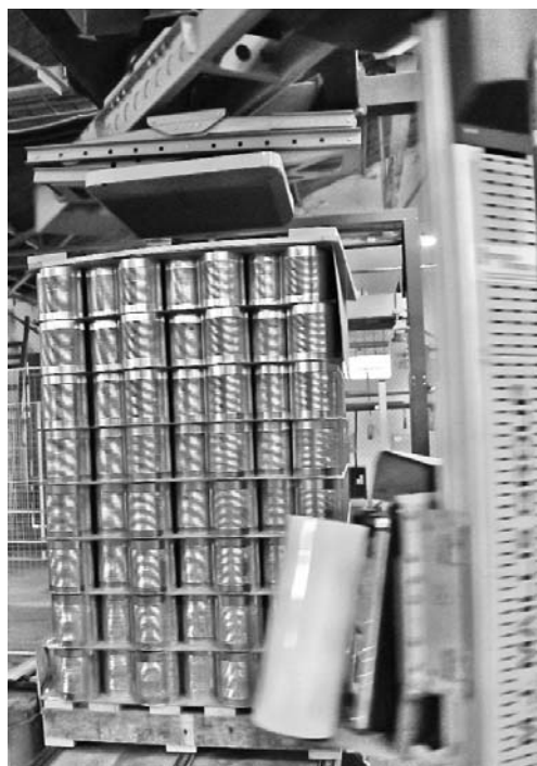
La automatización de los procesos de retractilado y flejado es uno de los avances introducidos.