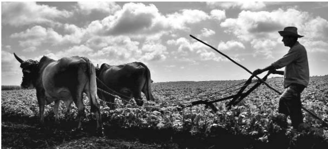
Ajeno a lo estipulado por el Decreto-Ley No. 142 de 1993, muchas veces “se naturalizó” la imposición a las UBPC de planes y dirigentes, limitando su avance y desenvolvimiento.