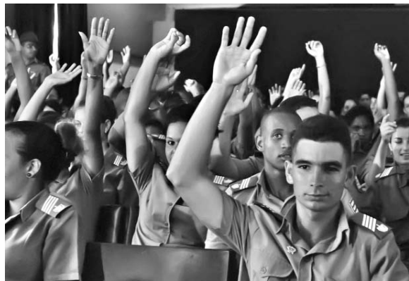
Los electores a mano alzada definieron por amplia mayoría al candidato a delegado.

Esta es la primera Asamblea de las tres previstas a efectuar en la Circunscripción 57, integrada por oficiales, cadetes y soldados de la institución docente de nivel