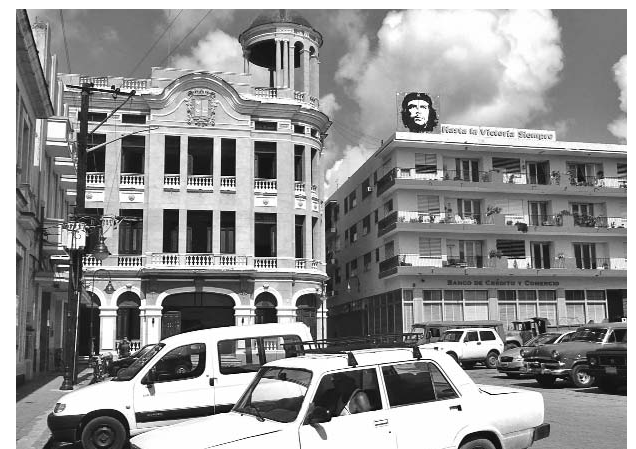
La céntrica Plaza de los Trabajadores cambiará su fisonomía como parte de las acciones del Programa Ciudad 500.

Con varias etapas en su concepción, el Programa Ciudad 500 extiende sus acciones integrales a la pintura de fachadas, la pavimentación de calles y avenidas, la rehabilitación de redes hidráulicas, la reparación de parques y el embellecimiento de las entradas de la ciudad.