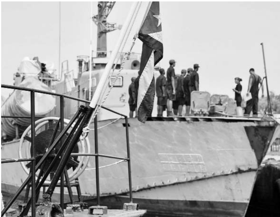
Garantizar la soberanía de las aguas jurisdiccionales cubanas: principal misión de la Marina de Guerra Revolucionaria.

Una vez que estuvieron alineadas todas las embarcaciones, a bordo del yate Granma pasó revista a la nueva Marina nuestro Comandante en Jefe Fidel Castro Ruz, quien aquella vez expresó: "¡Que sea esta siempre una Marina de Patria o Muerte!".