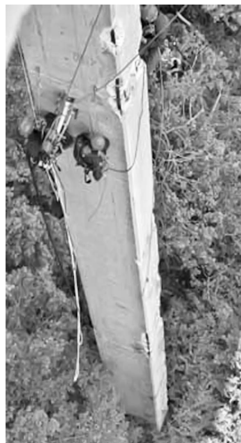
El uso de medios para la seguridad personal de los trabajadores es vital.

seguridad personal como las llamadas cuerdas de vida, guantes, cascos de protección y por supuesto el arnés, acotó Piedad Farías, directora de Desarrollo de la ECME, quien abundó que para estos trabajos se cumplen todas las normas de seguridad. "Incluso los andamios que se utilizan destacan entre los más seguros de los que existen en el país".