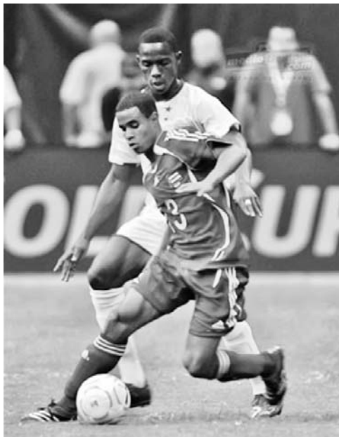
La última vez que ambos equipos se enfrentaron fue en la Copa de Oro del 2007.