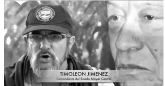
Rodrigo Londoño Echeverri (alias Timoleón Jiménez, Timochenko), Comandante del Estado Mayor Central de las FARC-EP.

Timochenko aseveró que la guerrilla guarda la sincera aspiración de que no se “intente repetir el pasado”, en referencia a los fracasos de los procesos de diálogo