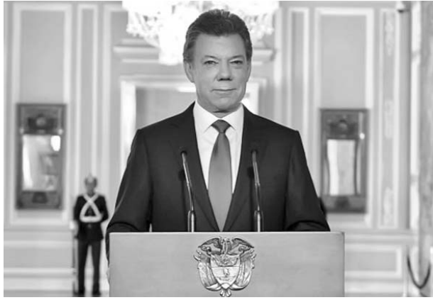
El presidente de Colombia, Juan Manuel Santos.

BOGOTÁ, 4 de septiembre.—El presidente colombiano, Juan Manuel Santos, oficializó hoy el inicio de las conversaciones entre su Gobierno y las Fuerzas Armadas Revolucionarias de Colombia-Ejército del Pueblo (FARC-EP) para alcanzar la paz tras más de medio siglo de conflicto armado.