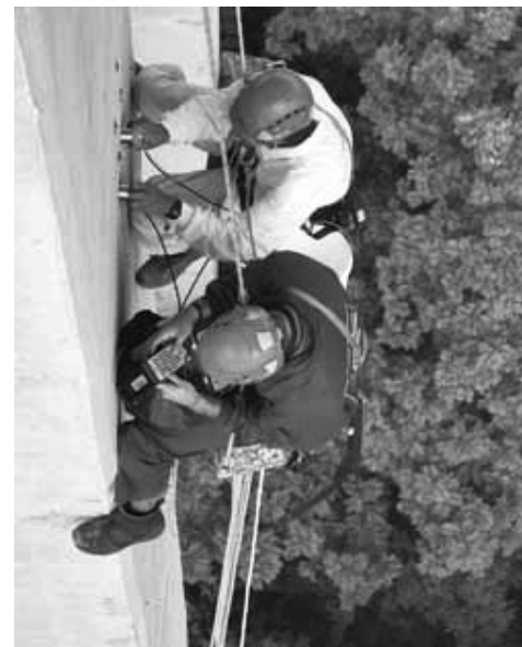
Desde 1976 no se realiza una reparación capital.

Los reparadores, dijo, utilizan mayas contra caídas, así como instalan plataformas de trabajo con pasadores de seguridad que evitan la absorción del viento. También usan otros medios de