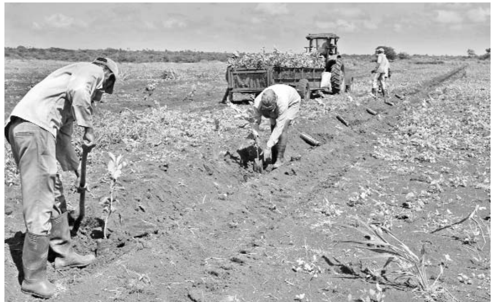
La siembra de frutales crece en Mayabeque.

Si se toma como referencia el cierre de julio se observará que, junto a una producción destacada (9 565 toneladas), también sobresale la siembra con un real acumulado de 971 hectáreas de las 580 que marcaba el programa de ese periodo.