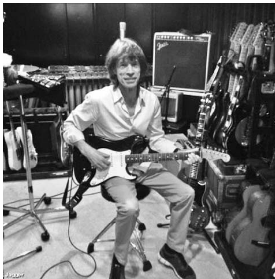
Mick Jagger en un estudio parisino de grabación.

A finales de abril se reunieron en Nueva York para ensayar y Keith Richards declaró: “Hemos tocado de todo. Ha sido como sonar en