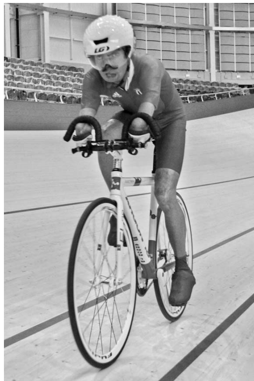
Damián López va por rebajar sus cronos en la pista y la ruta.

En los Paralímpicos de Beijing 2008, consiguió la medalla de oro en los 100, 200 y 400 metros. La final de los 100 metros del 6 de septiembre, en la que se le espera, debe ser uno de los puntos fuertes de los Juegos, ya que todos los participantes podrían bajar de los 11 segundos. (AFP)