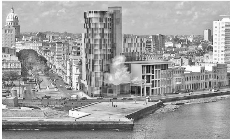
Esta sería una vista panorámica de la esquina de Prado y Malecón, y su entorno, de acuerdo con el proyecto del Estudio Choy-León.

Al comentar la obra en ese repertorio de excelencias, el pro-