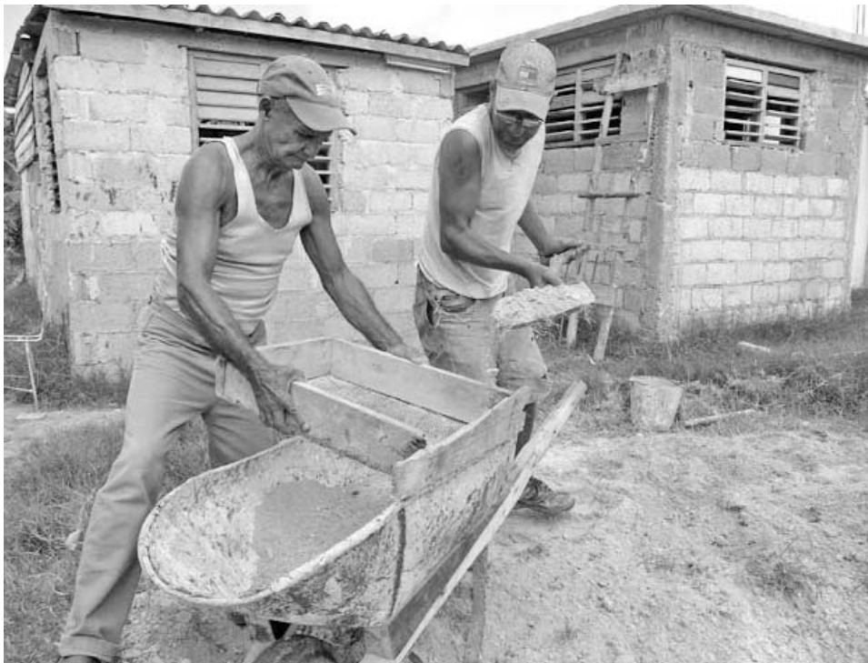
Después de ocho meses, la entrega de subsidios se consolida en esta provincia, donde todavía quedan pendientes miles de afectaciones causadas por los huracanes.

“Hasta el momento, se han enviado a los Consejos de la Administración Municipal (CAM) 952 expedientes, de los cuales, 357 fueron aprobados para recibir el