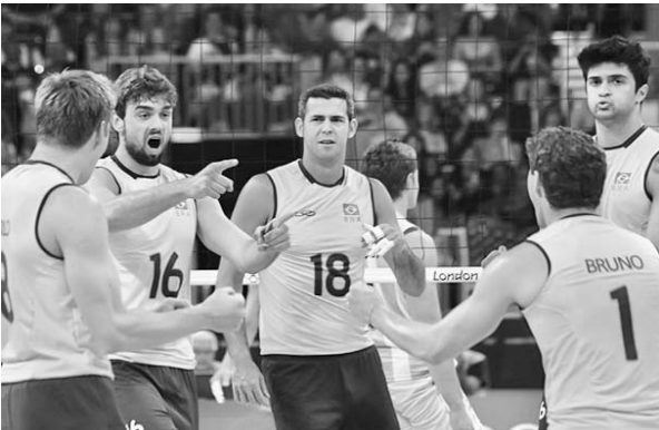
Los brasileños festejaron con autoridad su victoria.

Por su parte, Rusia, apoyada en un magistral Maxim Mikhaylov (25 rayas), superó 3-1 (25-21, 25-15, 23-25, 25-23) a Bulgaria y aseguró su cuarta medalla consecutiva en citas estivales.