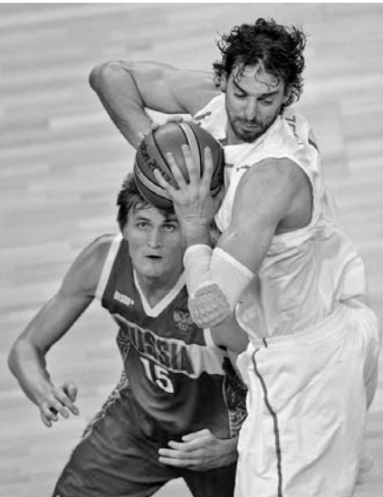
Apoyados en Pau Gasol, la España de Scariolo sepultó las aspiraciones de la Rusia de Kirilenko.

La nueva versión del Dream Team estadounidense ha empleado como abridores a Tyson Chandler, Kevin Durant, LeBron James, Kobe Bryant y Chris Paul. Así dispusieron 119-86 (28-21, 28-21, 28-28, 35-16) de Australia en los cuartos de finales, y ayer en la semifinal se vieron las caras por segunda ocasión con los argentinos y los vencieron 109-83 (24-19, 23-21, 27-17, 35-26), ofen-