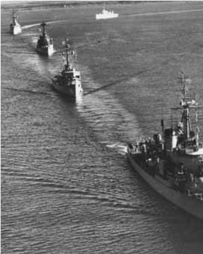
Eufemísticamente al bloqueo, Kennedy lo llamó “cuarentena”.

El presidente Kennedy ordenó que se efectuaran los preparativos necesarios para el caso de un posible bloqueo de Berlín. También se discutió detalladamente lo que se haría si uno de los U-2 era derribado; se convino en que, llegado el caso y con la autorización expresa del Presidente, sería destruida la base de cohetes antiaéreos que lo hubiera derribado o una cercana, si no se podía establecer con exactitud cuál lo había hecho. El secretario de Defensa expresó que el ataque se realizaría dentro de las dos horas siguientes al momento en que se tuviera conocimiento del derribo del avión. El Presidente manifestó gran preocupación ante la posibilidad de cualquier error, y dijo que, antes de replicar, debía comprobarse bien el ataque contra los aviones propios. Convino con el secretario de Defensa en preparar la 101 División Aerotransportada para entrar inmediatamente en acción si era necesario. Quería asegurarse de que se habían tomado todas las