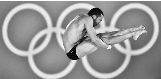
Guerra tendrá que apostar a su clase si quiere festejar su 33 cumpleaños con el pase a la final.