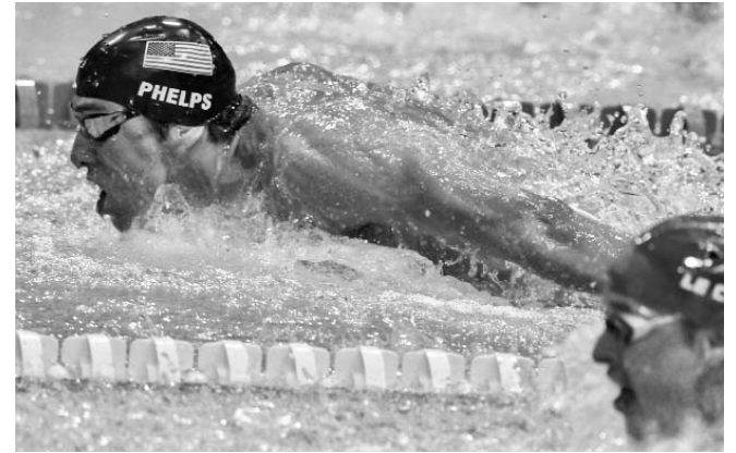
Phelps es el multimedallista más grande de la historia con 20 preseas (16-2-2).