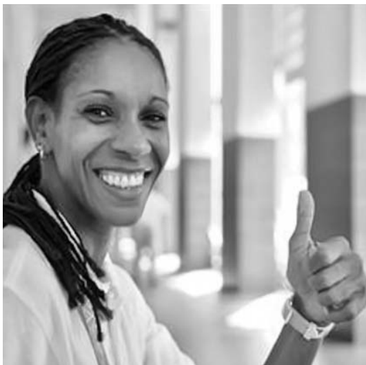
“Hasta ahora la organización ha sido excelente”, expresó la miembro de la Comisión de Atletas del COI.

“Estoy ayudando a nuestros atletas, aunque mi principal función como integrante de la Comisión de Atletas del Comité Olímpico Internacional, es recopilar experiencias diarias sobre cómo funcionan el transporte, la