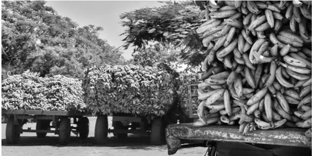
Mientras aparecen las soluciones, considerables volúmenes del rubro “escuchan el cuento” y se descomponen.

CONSIDERABLES VOLÚMENES DE PLÁTANOS SE PIERDEN... EN TANTO SE COSECHA